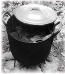
ໝໍ້ໄຜ່ນກຳອາບ