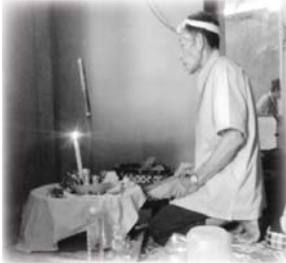
ໝໍ້ໄຜ່ນກຳອາບຮັກພິກັດເຍົາ