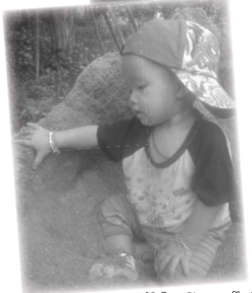
ຈັນສິລາ ຄົບຮອບປາ ປີແລ້ວ