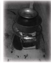
ໝໍ້ໄຜ່ນກຳອາບ

ຍາວພິໄດ້ກວ້າງ ໃຕ້ປົກບໍ່ມີຂົນ ເປັນນົກທີ່ບິນຊ້າ...)