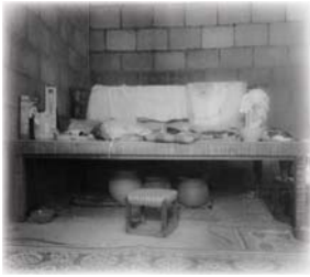
ດູງູ່ໄກ່ອຳ