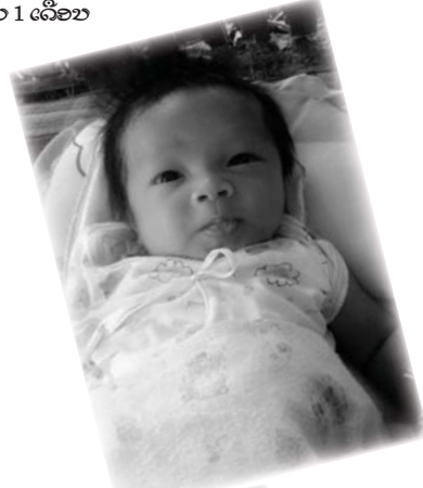
ລົບຮອບ 1 ເລື້ອນ

ສົມພໍດອກຊ່ວງສອງອາທິດຫຼັງນີ້ຂ້າພະເຈົ້າຮູ້ສຶກຢາກກິນແຕ່ສົ້ມ ກິນທີ່ໃດກໍຄິດວ່າອິ່ມບໍ່ເປັນກິນໄດ້ຕະຫຼອດເວລາບົດລະຢາກ ຄາວລະຢາກ ທຳອິດຄິດວ່າແມ່ນຕົນເອງເປັນຫຍັງ ຢາກກິນແຕ່ສົ້ມຢ່າມຸ່ງເຈັບທ້ອງເຈັບໄສ້ຊິເສຍເວລາເຮັດວຽກໄປຮຽນແພດອີກແຫຼະ ສຸດທ້າຍແລ້ວກໍແມ່ນມີຄົນນ້ອຍຢູ່ໃນທ້ອງນີ້ເອງ.