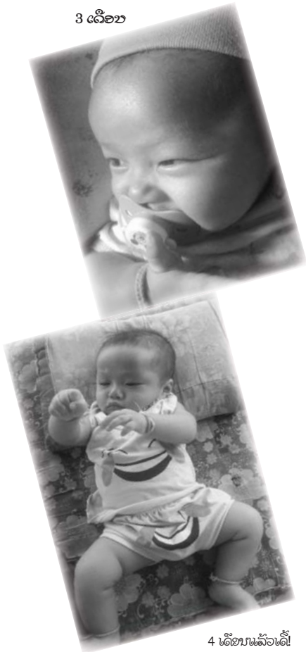
4 ເລືອບແລ້ວໄດ້!

ທີ່ມີໃຫ້ ຈິ່ງພໍເຮັດໃຫ້ຂ້າພະເຈົ້າໝັ້ນໃຈໄດ້ວ່າລາວຈະບໍ່ຕົວະແນ່ນອນ.