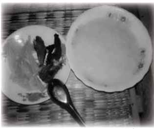
ຊອງອິນຢູ່ອຳ (ເຂົ້າປຸງອາ, ລວກເຜັດ, ຊີ້ນໄຜ່)