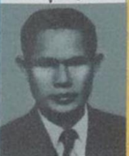
ນະຫາສີລາ ວິຣະວົງສ໌