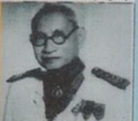
ທ່ານ ສິມຈິນ ປີແອງງິນ ປະທານຮາຊບັນດິຕສະພາລາວ