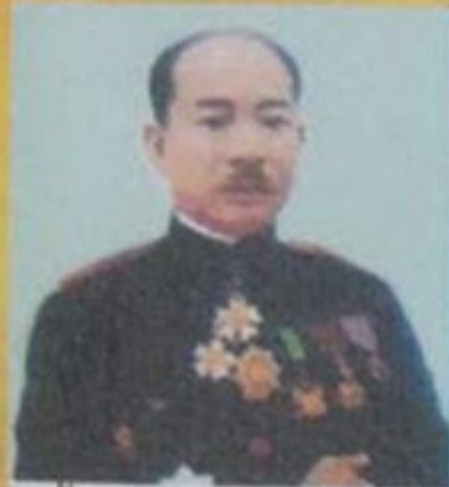
ເຈົ້າເພັດຮາຊ ຣັຕນວົງສາ