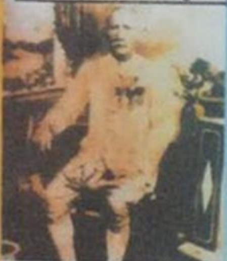
ນະຫາແກ້ວ ແກ້ວຮາຊະວົງ ໂຊ