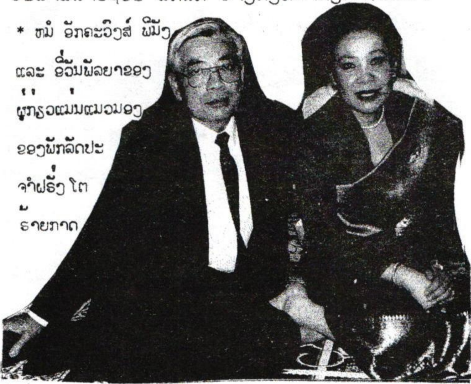
* ໝໍ ອັກຄະວົງສ໌ ພິມັງ ແລະ ອິວັນພັລຍາຂອງ “ ຕູ ເຢີ ” ຜູກຮວແມ່ນແມ່ນວມອງ ຂອງພັກລັດປະ ຈຳຝຣັ່ງ ໂຕ ຮາຍກາດ

ນິກອິນທຣີ, ນິກເຕັ້ນຊິວ ທັງຫລາຍໃຫ້ພາກັນແມ່ນມັນ. ຂອບໃຈພວກທ່ານຫລາຍໆທີ່ສົ່ງຮາຍງາມສພາພກາຣມາ ໃຫ້ ແລະ ກໍຮອດສຳນັກງານສູນຍ໌ກາງພຸກໆຢ່າງ.