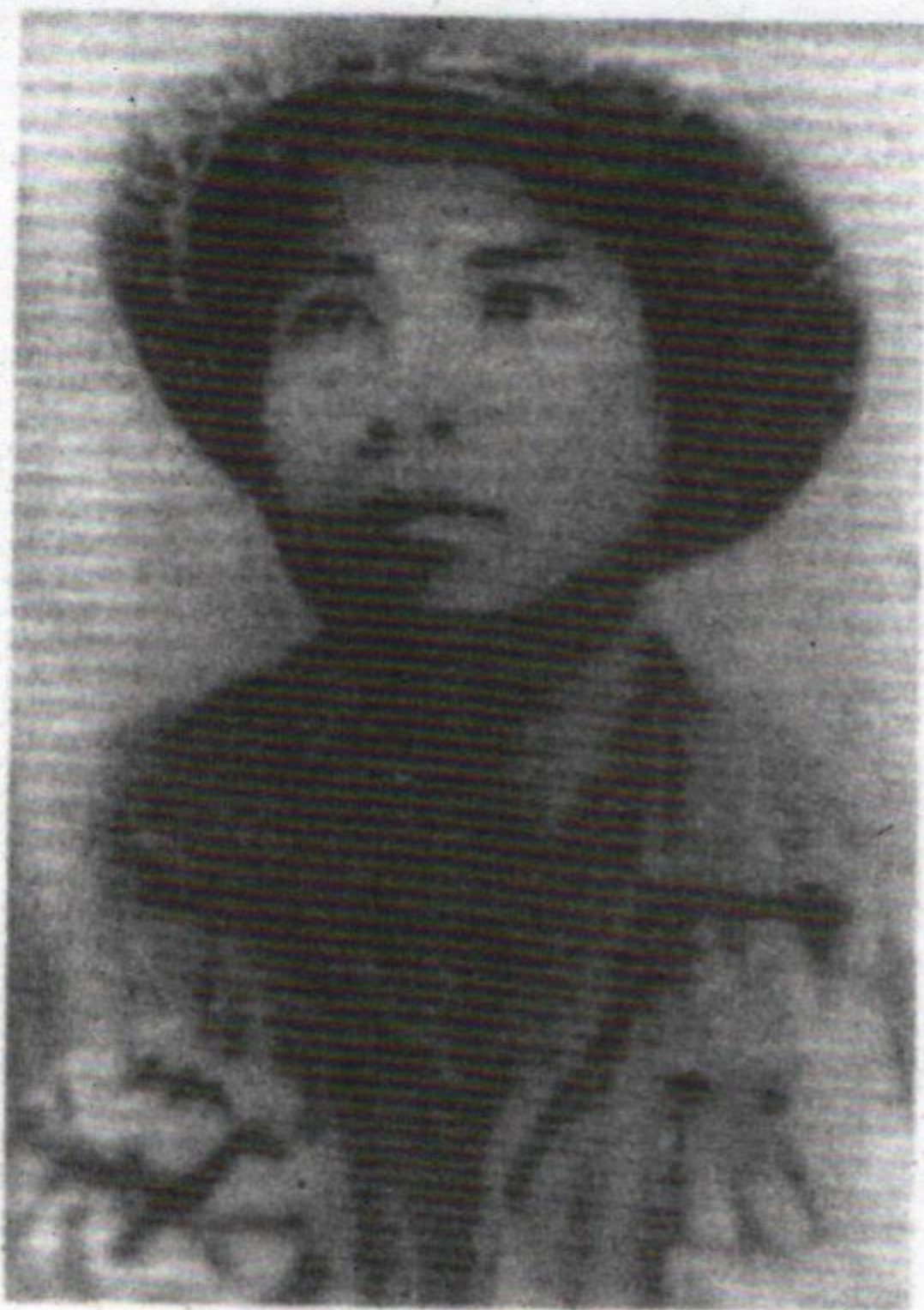
ສີທອງ ວິລະຊົນແຫ່ງຊາດ