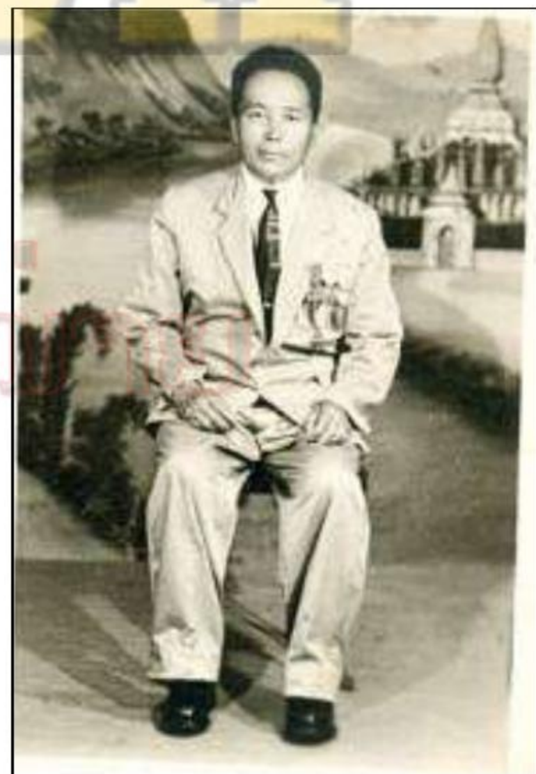
ຮູບທີ່ 6. ທ່ານ ປະຈ້າລີ ຜູ້ນຳທີ່ຮ່ວມກັບທ່ານຕູ້ເລັຍ ລີຜຸງ ໄປເກັບເກັນປະຊາຊົນເຜົ່າມົ້ງ ໃນເຂດເມືອງຜາ ແລະ ພູຜາໄຊ ໄປປົດປ່ອຍເມືອງຊຽງຂວາງໃນວັນທີ່ 27 ເດືອນ ມັງກອນ 1946