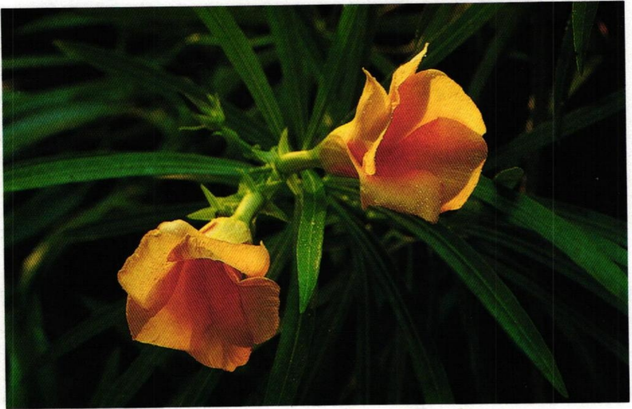
33. รำเพย (Yellow Oleander : Thevetia peruviana )