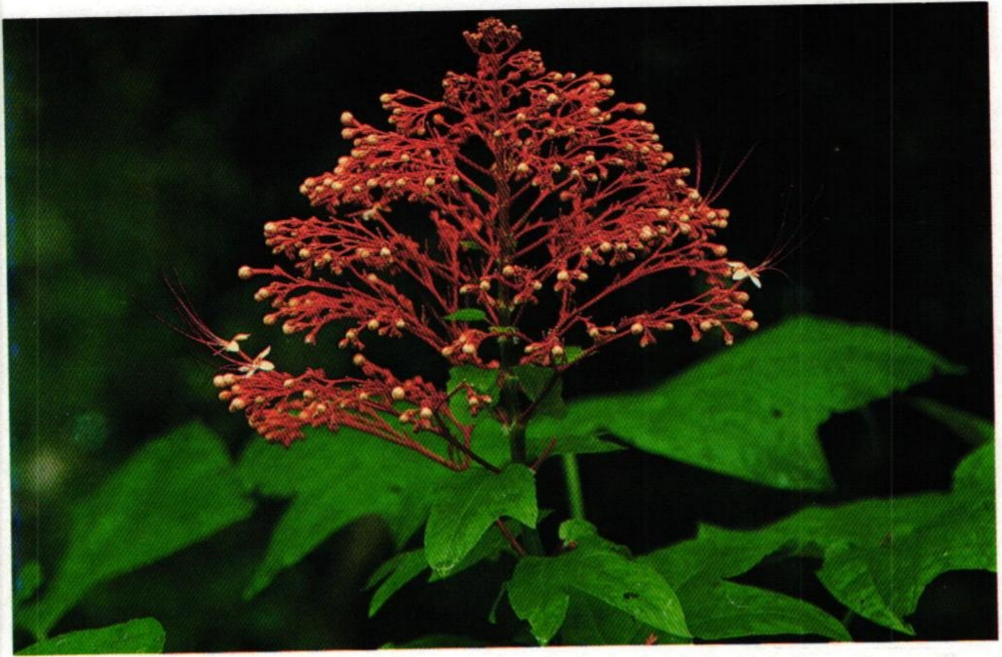
9. นมสวรรค์ หรือ พนมสวรรค์ (Pagoda Flower : Clerodendrum buchananii )

ลำควนบุนนาคสาวหยุด ยี่สุ่นสารภีมะลิวัลย์