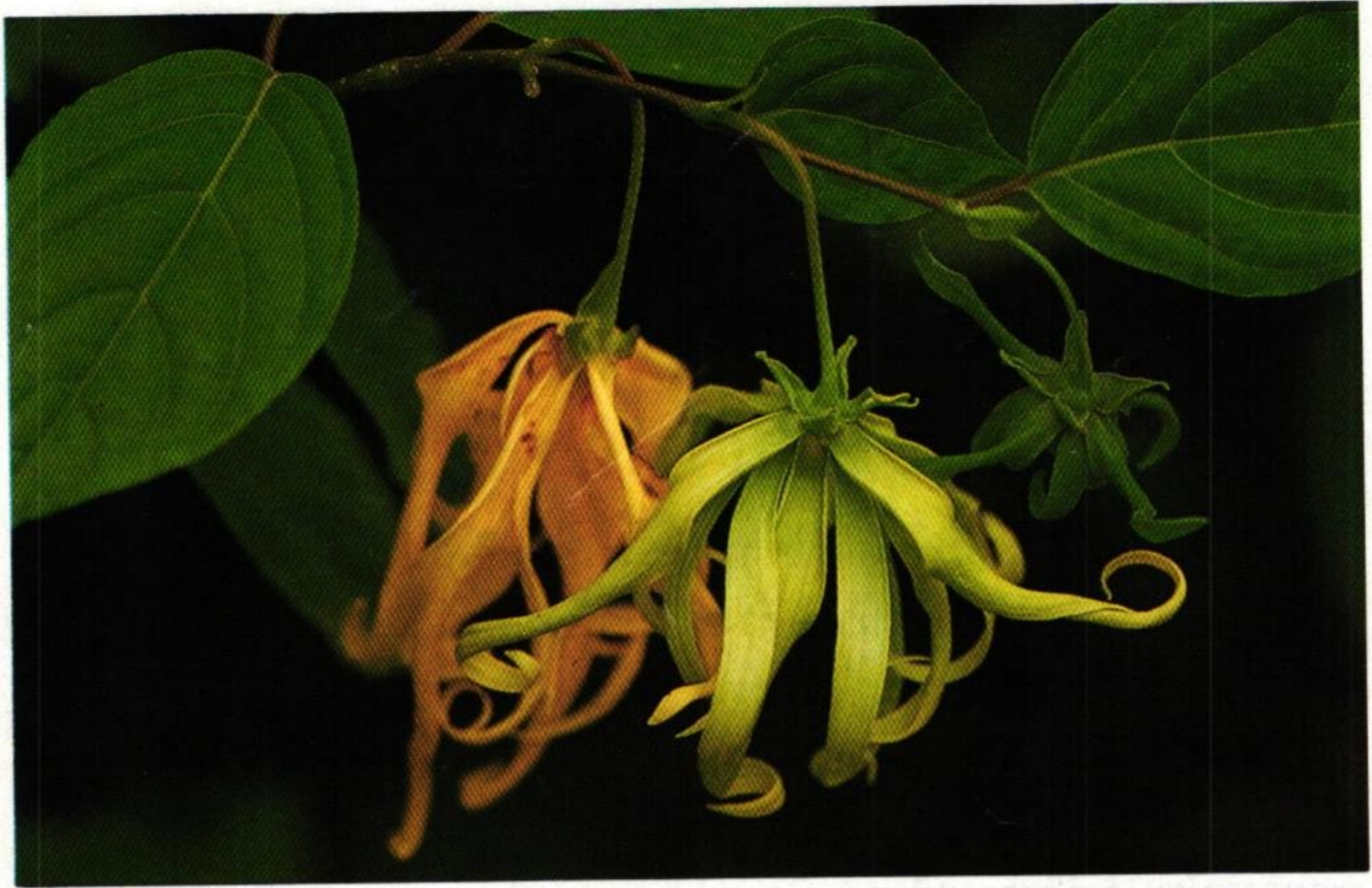
1. กระจ่าง (Perfume Tree : Cananga odorata )

แก้วกุหลาบกาหลงประยงค์แย้ม มหาหงษ์มหาดเทียงกระจ่าง