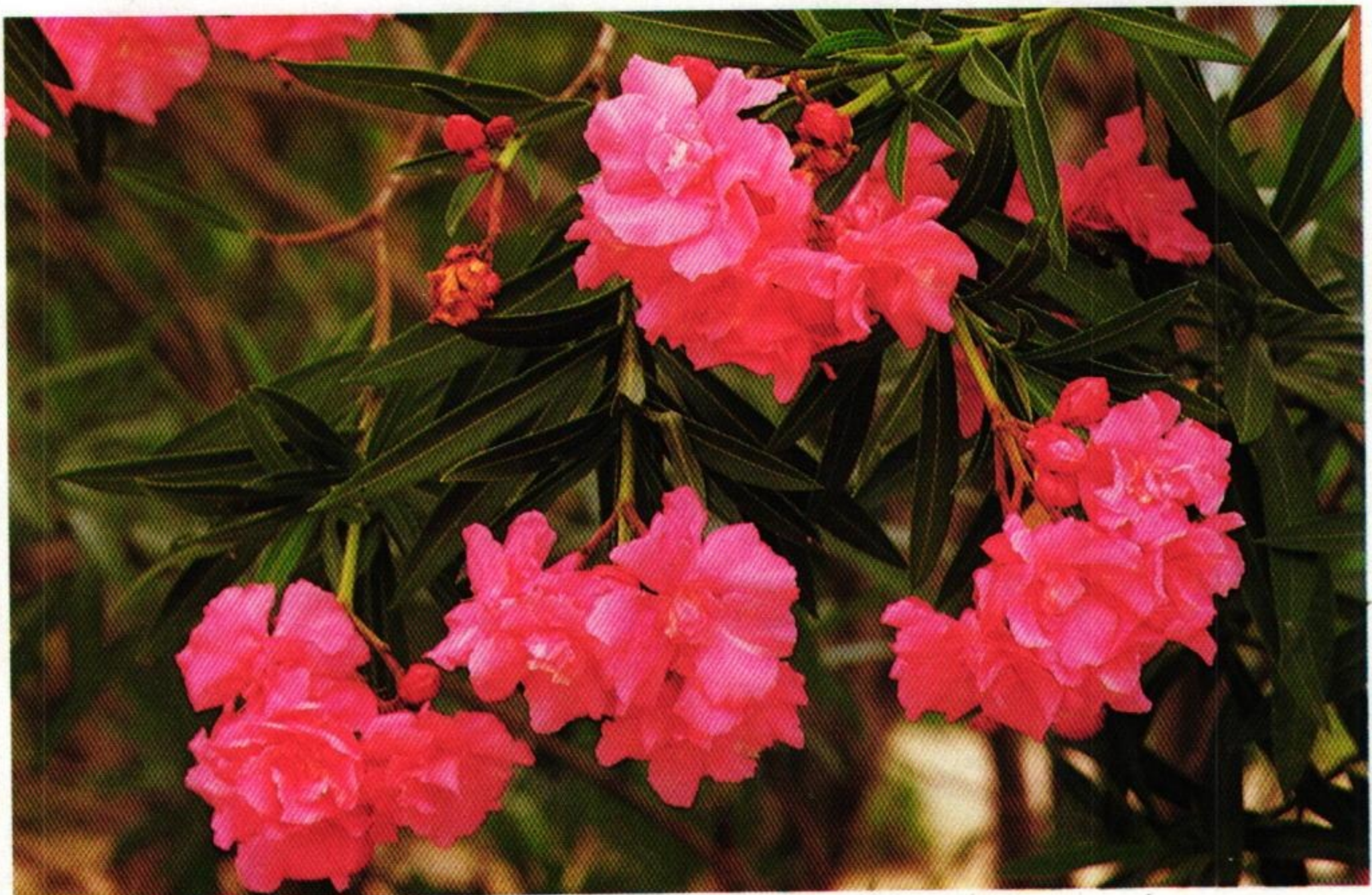
42. ยี่โถ (Rose Bay : Nerium oleander )