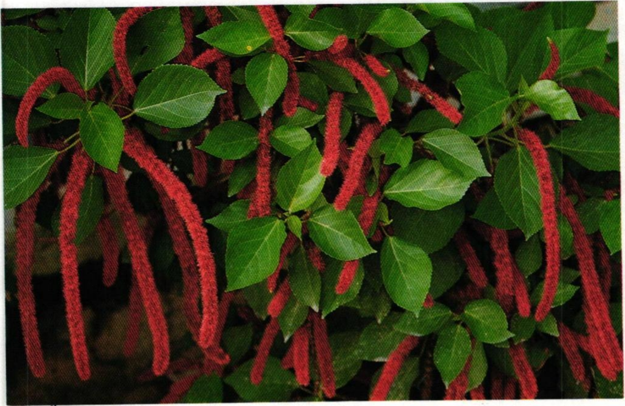
21. เกี้ยวเกล้า หรือ ทางกระรอกแดง (Pussy Tail : Acalypha hispida )

พระชมการะเกดแก้ว หอมหันทนกลเกศา พระชนมุลิตา ชมดอกไม้เกี้ยวเกล้า