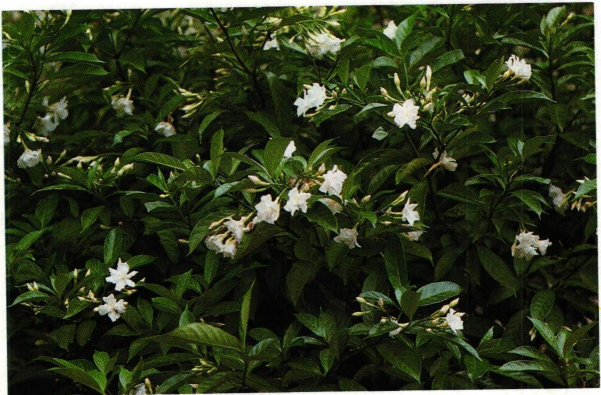
6. พุดจิบ ( Grape Jasmine : Ervatamia divaricata ) พอเข้าป่าพาใจให้ชื่น สายหยุดพุดจิบปีบจำปา

สมเด็จพระนเรศวรมหาราช (พ.ศ. 2155) ทรงพระประชวร มาถวายพระน้องต้องประสงค้ ลมส่งกลิ่นกลบตรหลบไป อิเหนา