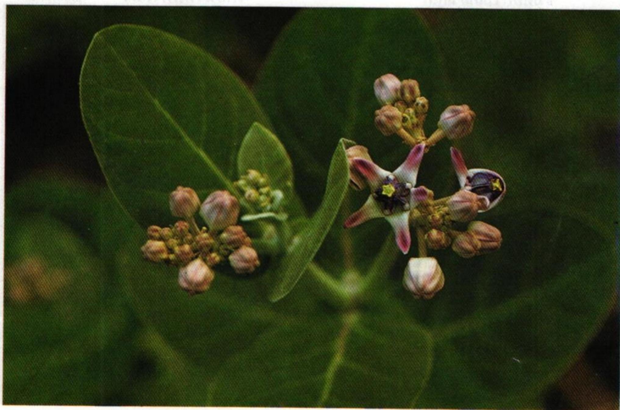
20. รั้ว (Crown Flower : Calotropis gigantea )

พวกข้าหลวงหน่วงน้ำวถึงสาวหยุด บ้างเด็ดดอกโศกแซมแถมดอกรั้ว