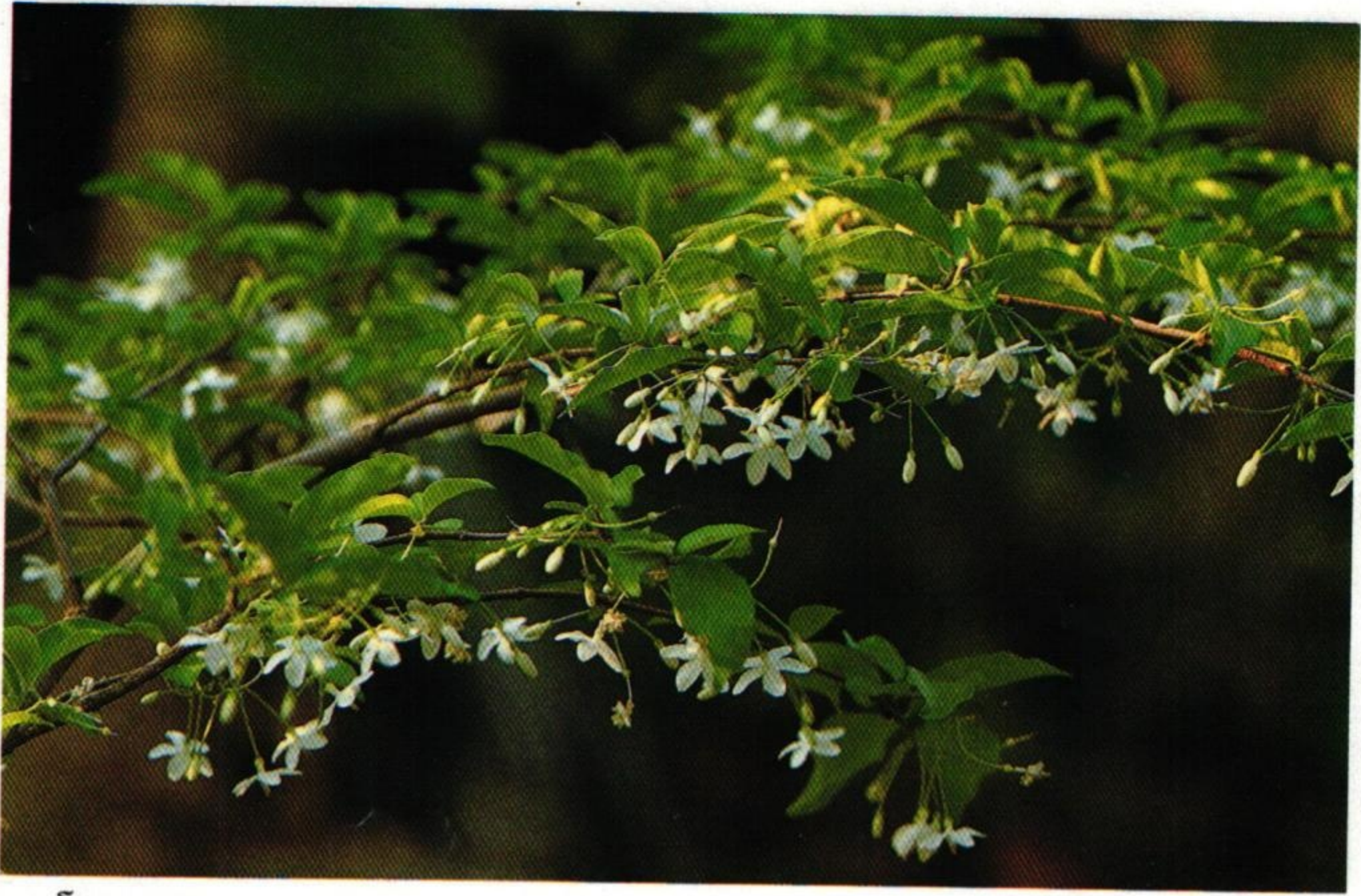
7. โมก ( Wrightia religiosa )

นางนวลจับต้นอินทนิล เกล้าโมงจับโมกเมียงมอง