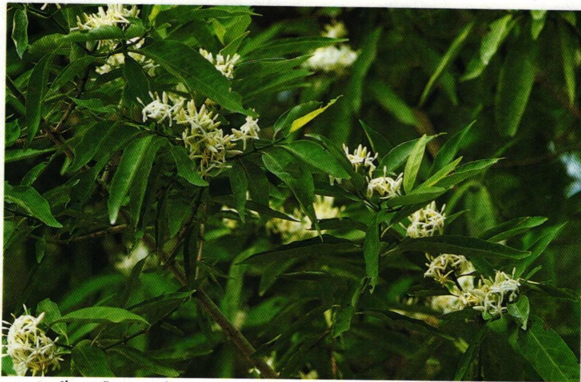
15. กัดแก้ว หรือ กัดเกล้า ( Randia siamensis )

มะลิวัลย์พันธุ์พุ่มกัดแก้ว บ้างเลี้ยวเลี้ยวเกี่ยวกิ่งเหมือนชิงช้า