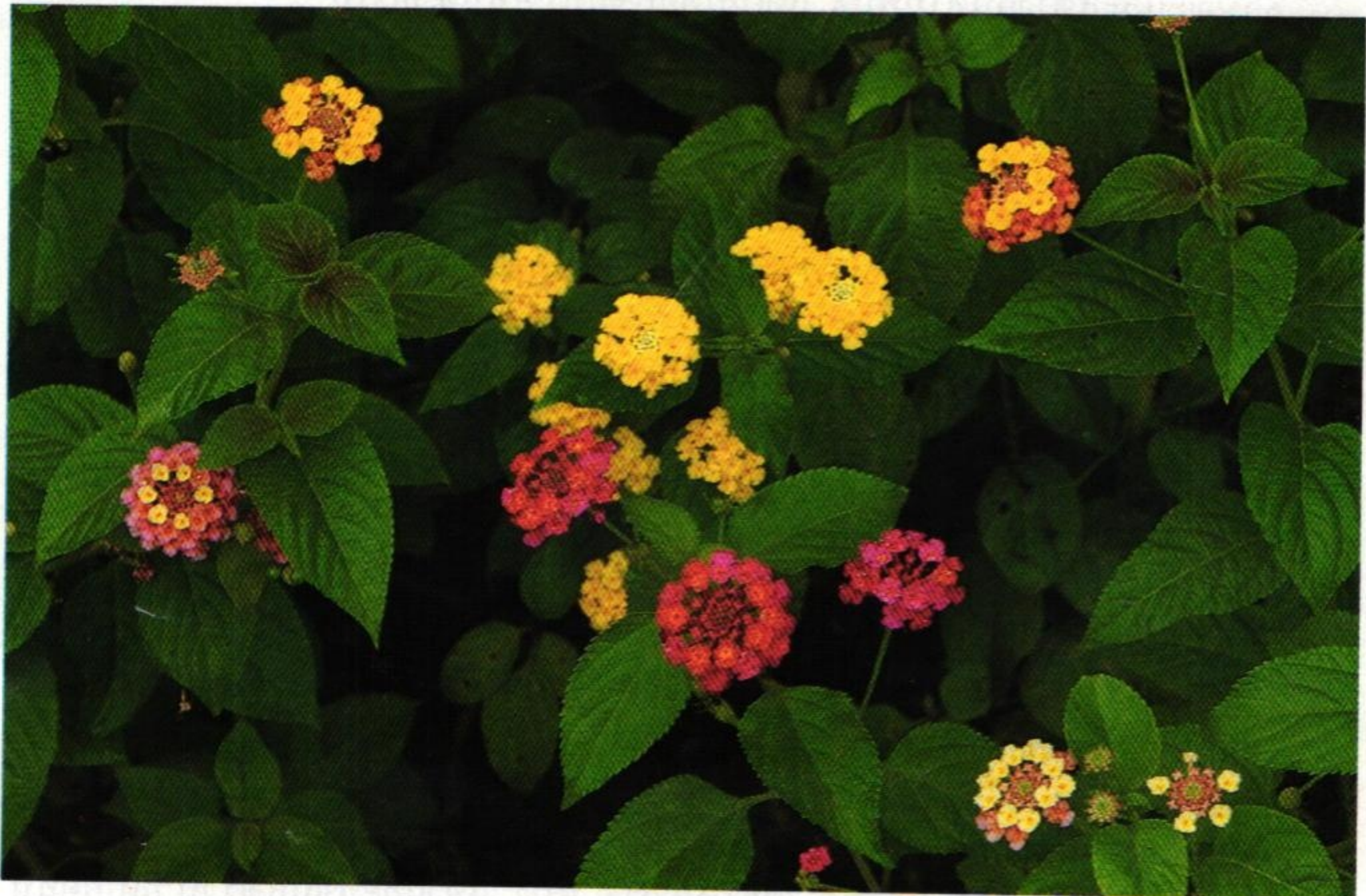
44. ผกากรอง (Cloth of Gold : Lantana camara )

มะลิวัลย์พันระกำขึ้นแกมจาก จำปีเคียงโศกระย้าผกากรอง