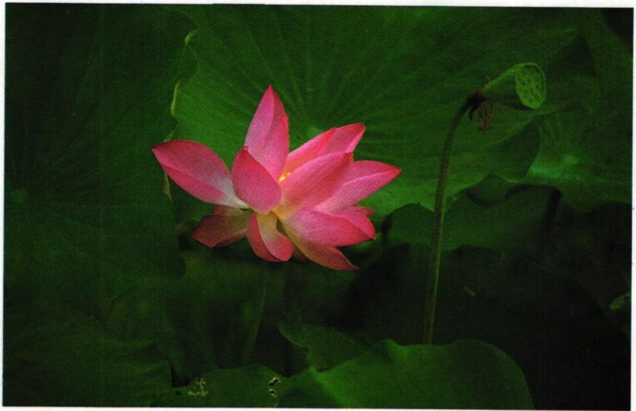
39. บัวหลวง (Indian Lotus : Nelumbo nucifera )

เห็นบัวหลวงช่วงชิงกันเก็บมา มะเดหัวชี้บอกนางอนงค์