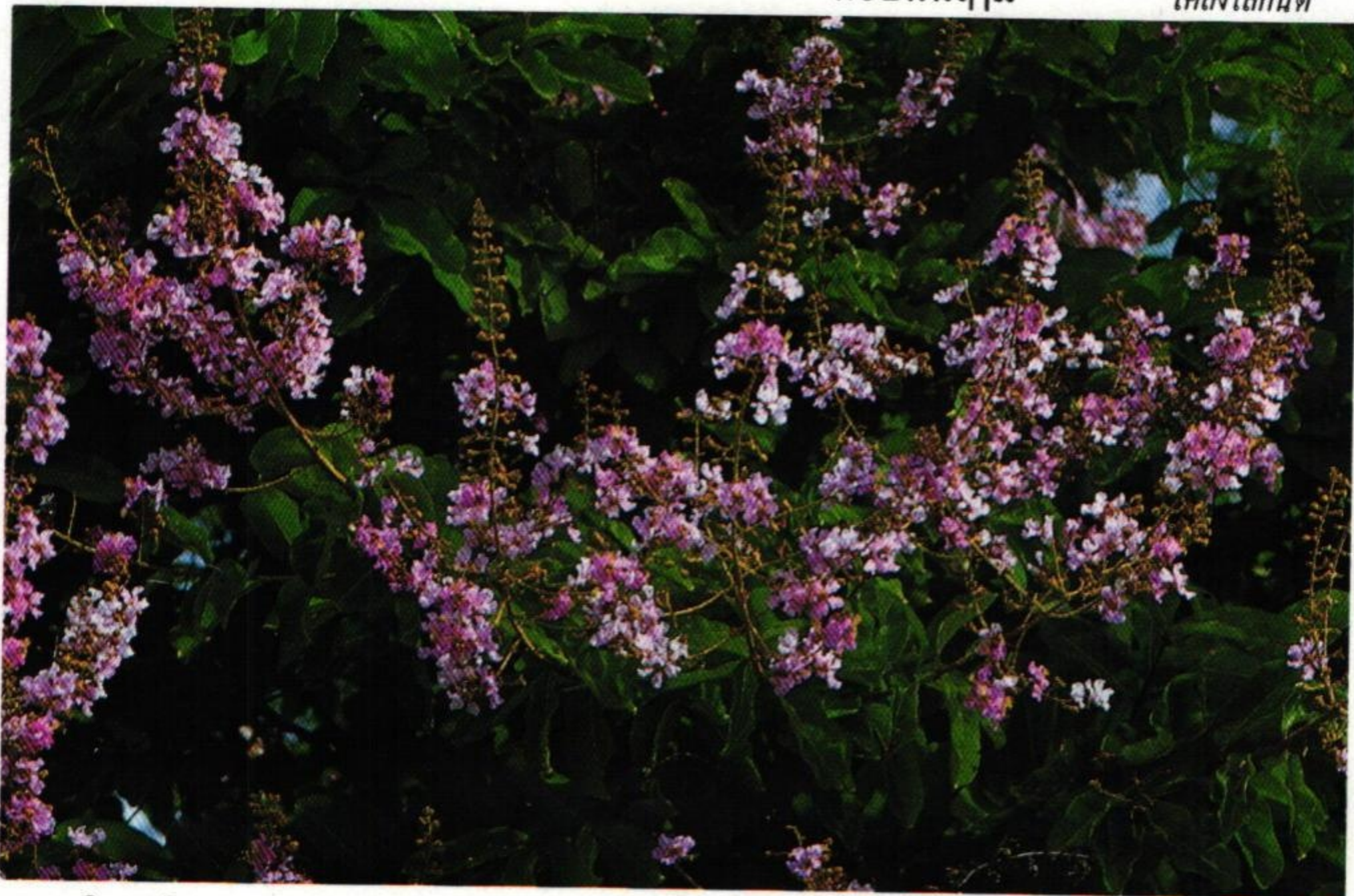
28. อินทนิล (Queen's Flower : Lagerstroemia speciosa )

อินทนิลนางแย้มโยทะกา ช่อนชู้ฉ้อฉลฉุนกันทร