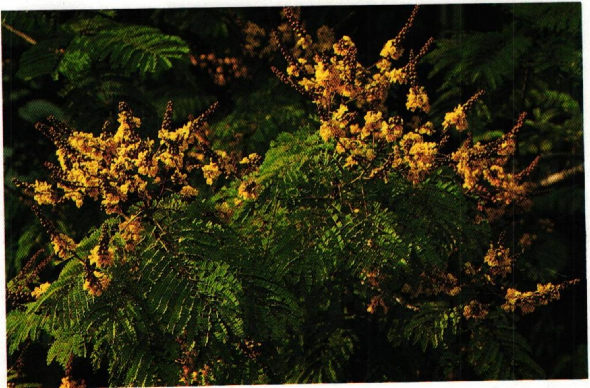
26. นนทรี (Copper Pod : Peltophorum pterocarpum )