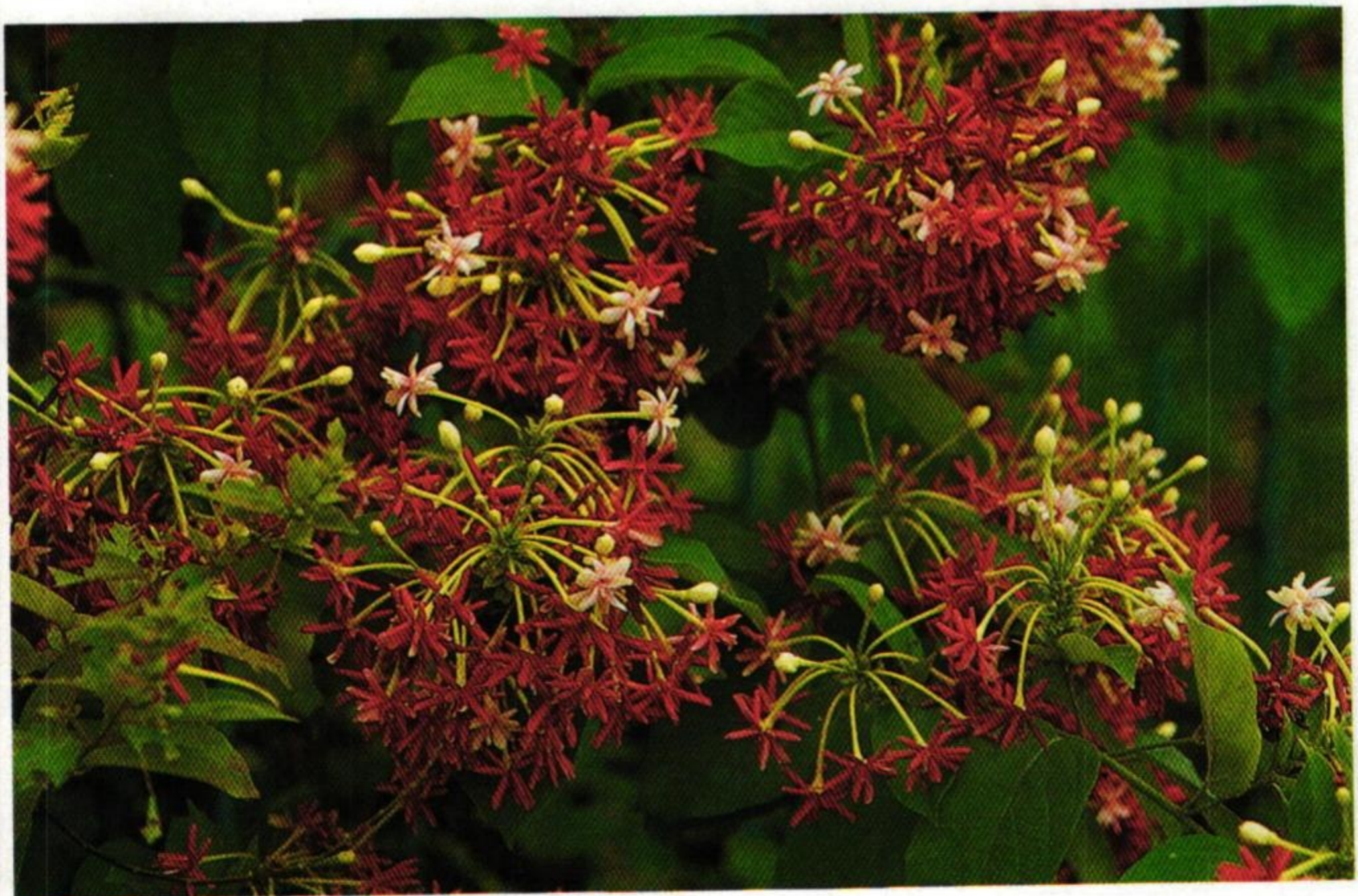
18. เล็บมือนาง ( Quisqualis indica )

กระเหว่าจับกระวานประสานเสียง นกเอี้ยงจับเอื้องชำเลื่องดู อิเหนา