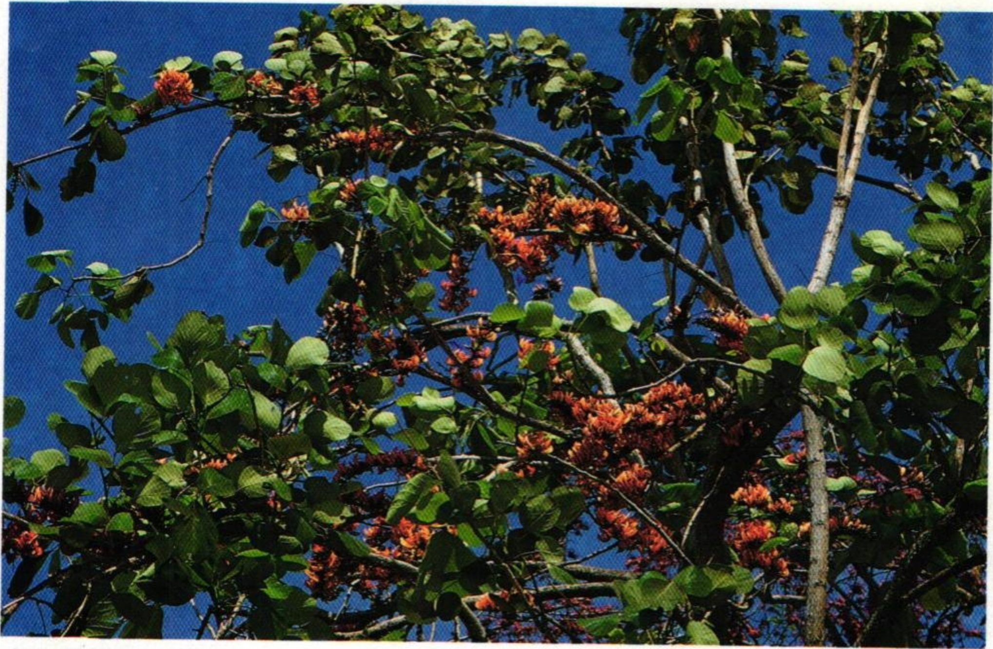
27. ทองกวาว ( Butea monosperma )

ทองกวาวหงอนไก่เส็ง งามแต่กลิ่นฉุน นักเรียนนอกบาลี งามผาดผลเท่าก้อย