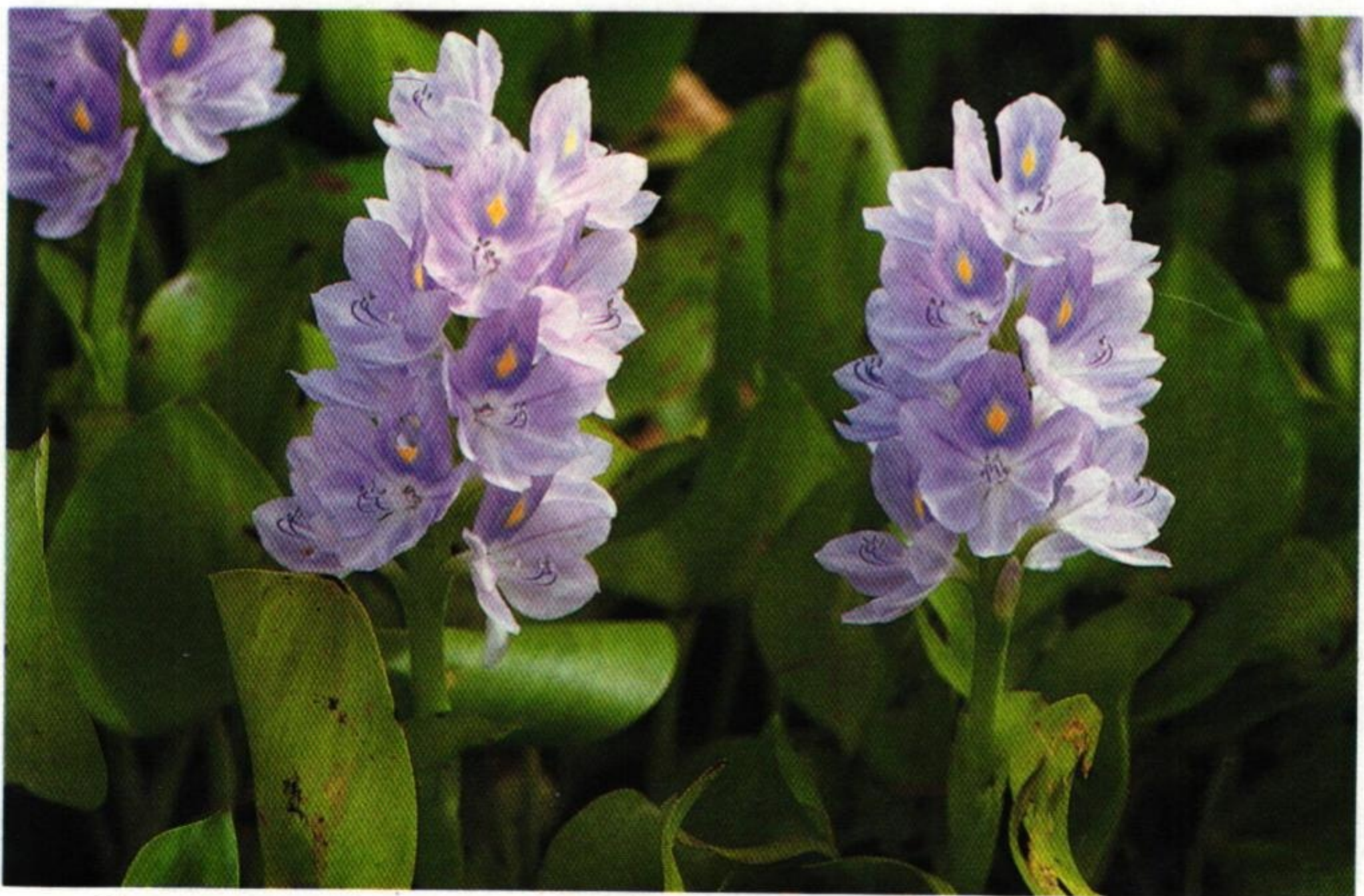
40. ผักตบชวา (Water-hyacinth : Eichhornia crassipes )

เห็นผักตบดับเต่าเหล่าสาหร่าย ฝักกระเจดแพงพวยสลวยลอย