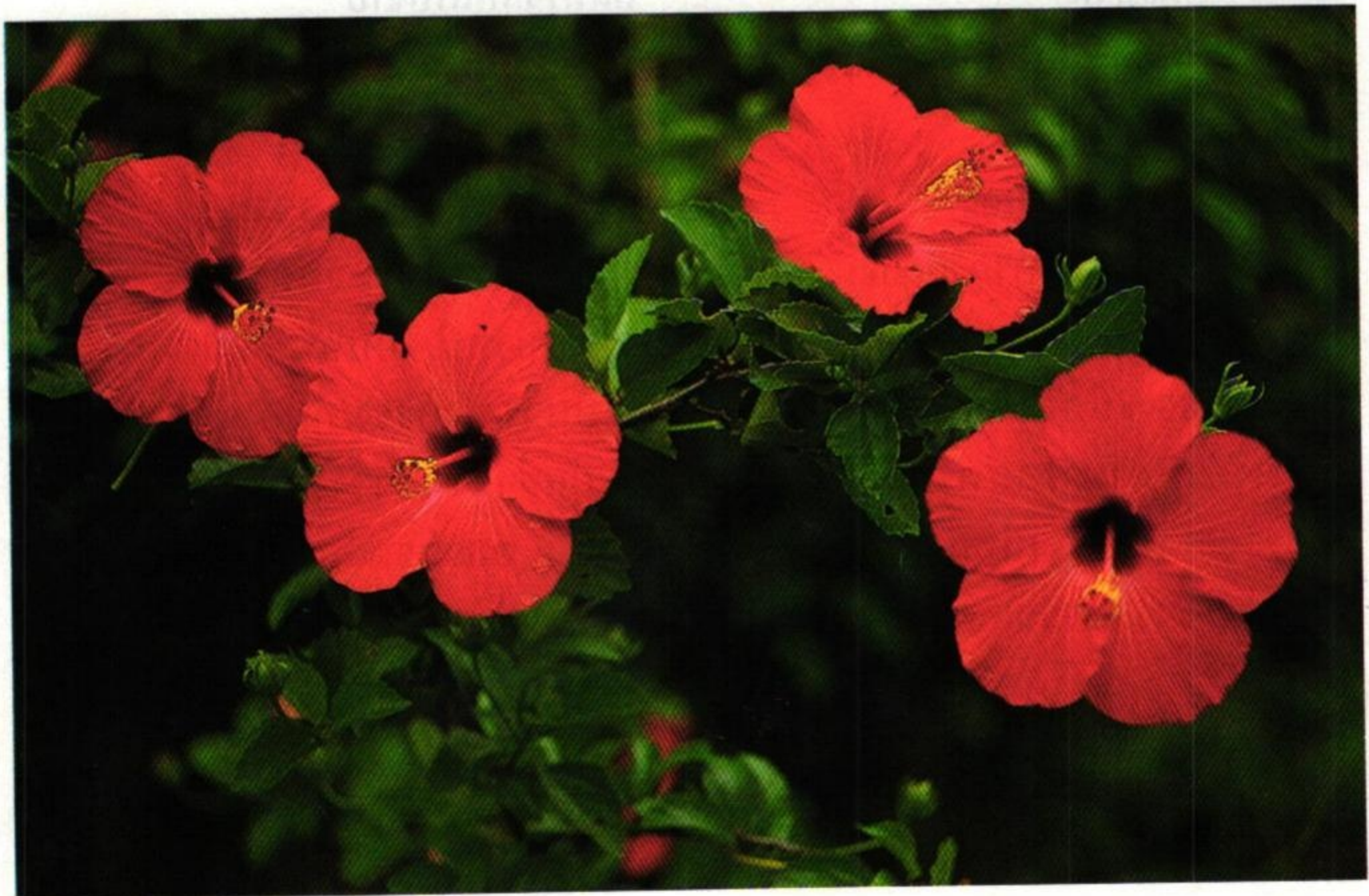
2. ชบา (Show Flower : Hibiscus rosa-sinensis )

เที้ยวเก็บบุปผามาลาศ กุหลาบกาหลงมะลิวัลย์