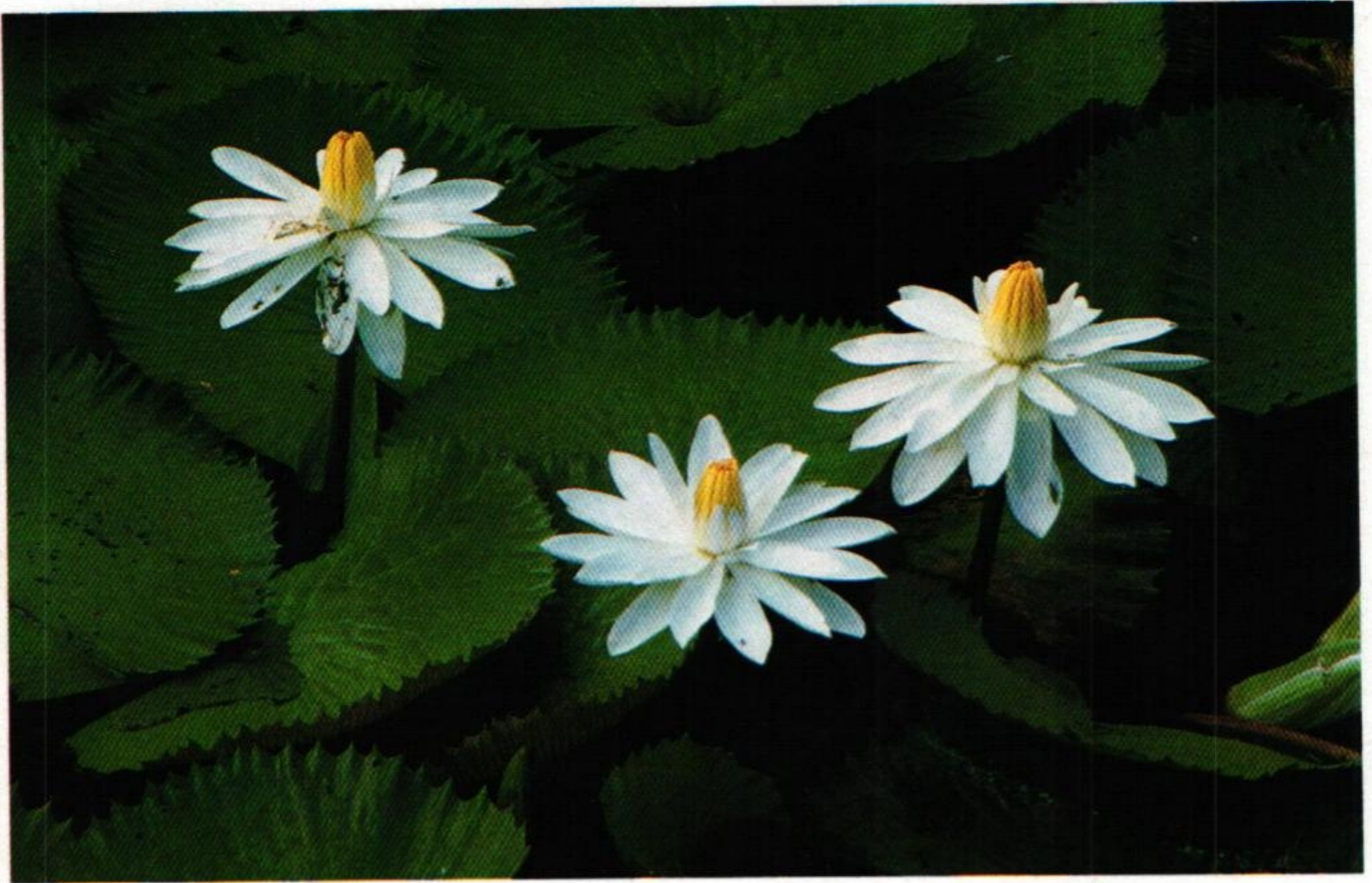
37. สัตตบุษย์ หรือ บัวขาว (White Water Lily : Nymphaea lotus )

สัตตบุษย์บัวแดงขึ้นแฝงฝัก แพงพวยพุ่งพาดพันสันตะวา