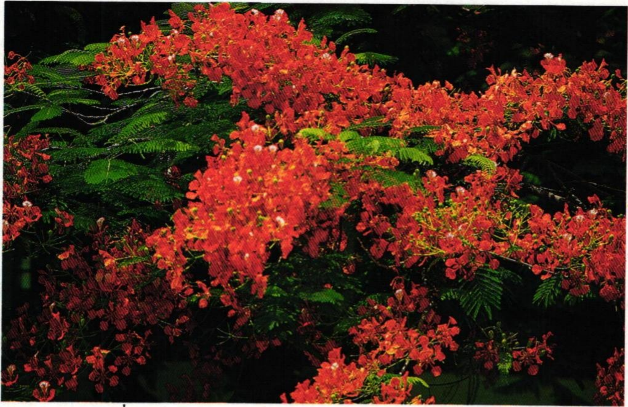
35. หางนกยูงฝรั่ง (Gold Mohur Tree : Delonix regia )

ประยงค์เข้มแกมสุกรมนมสวรรค์ ทั้งคัดเค้ากฤษณาจำปาแดง