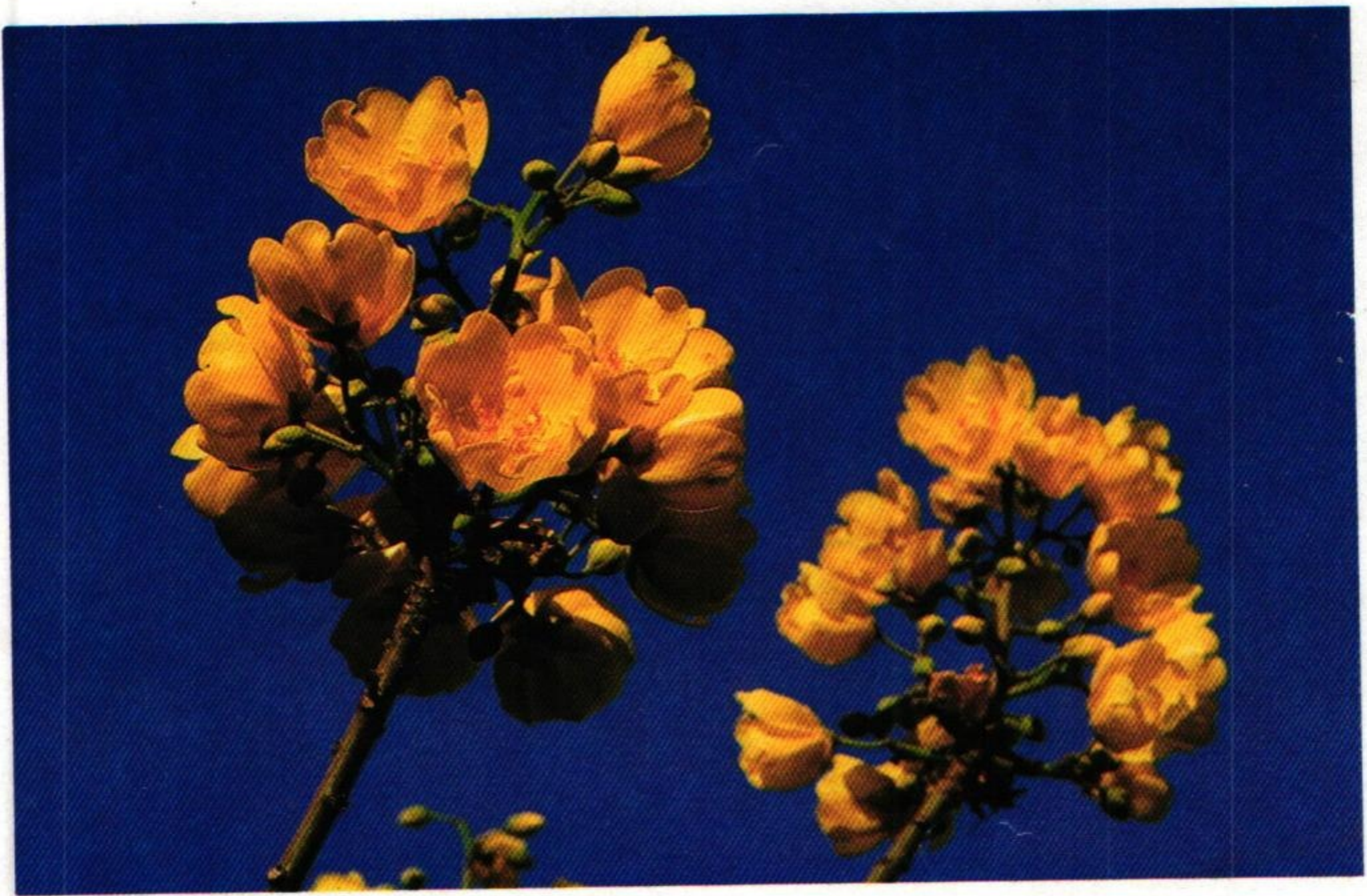
13. สุพรรณนิการ์ (Yellow Silk-Cotton Tree : Cochlospermum gossypium )