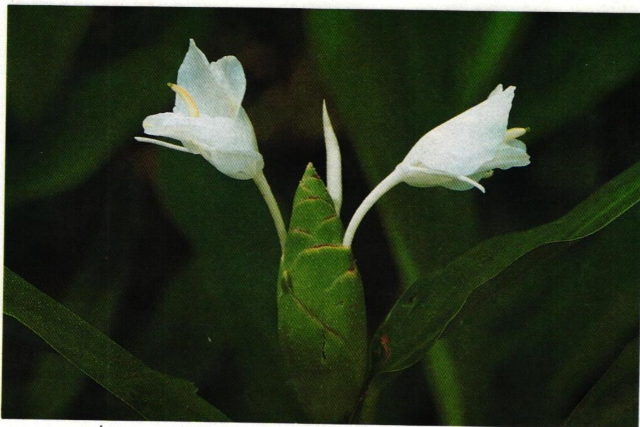
16. มหาหงษ์ (White Ginger : Hedychium coronarium )

พลาจชมดอกดวงพวงพกา สาวหยุดพุดจีบปีบประยงค์