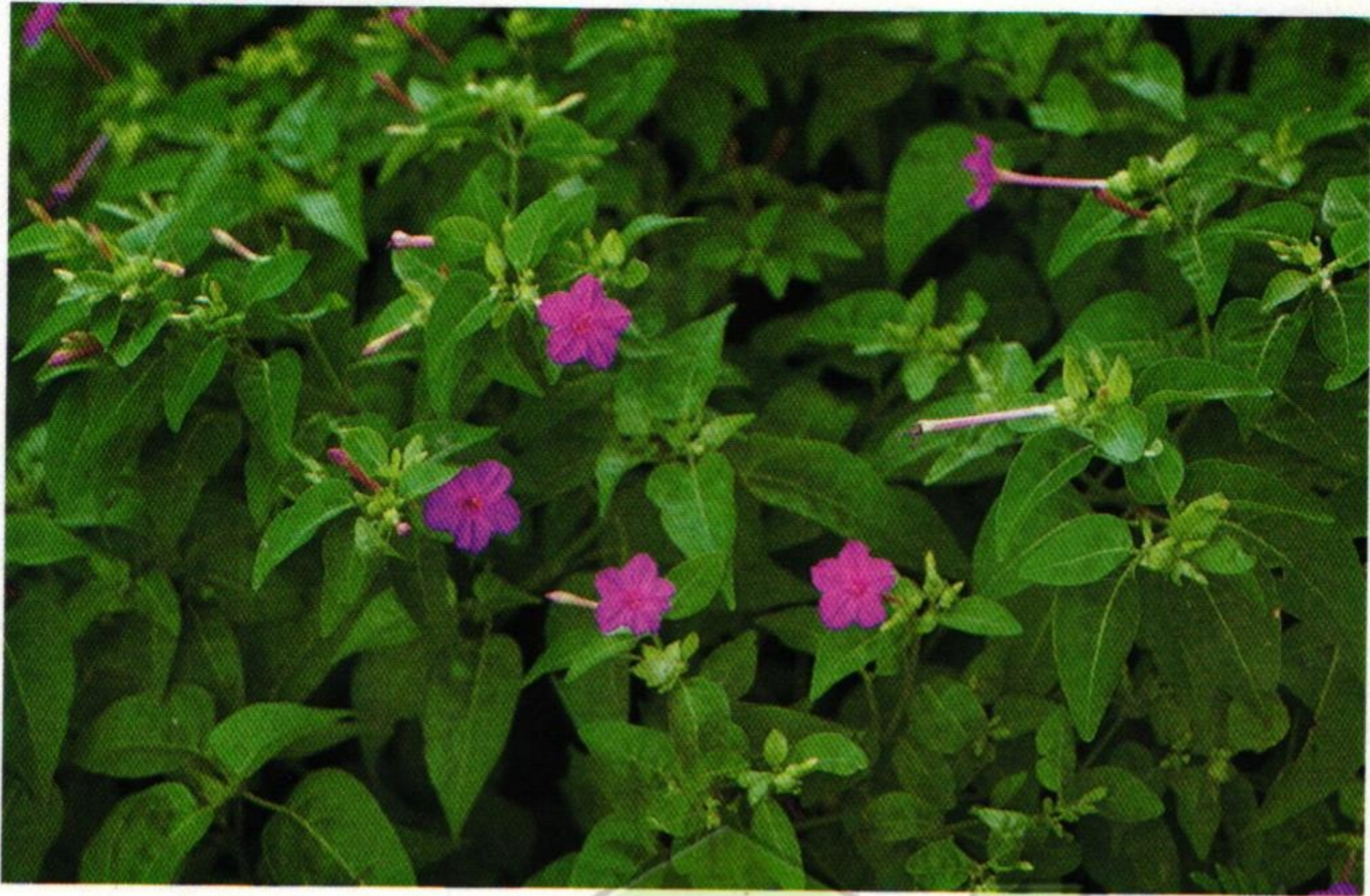
31. บานเย็น (Marvel of Peru : Mirabilis jalapa )

นางงามบ้างเก็บลูกบานเย็น ที่สันทัดดัดจริตบิดพริ้ว