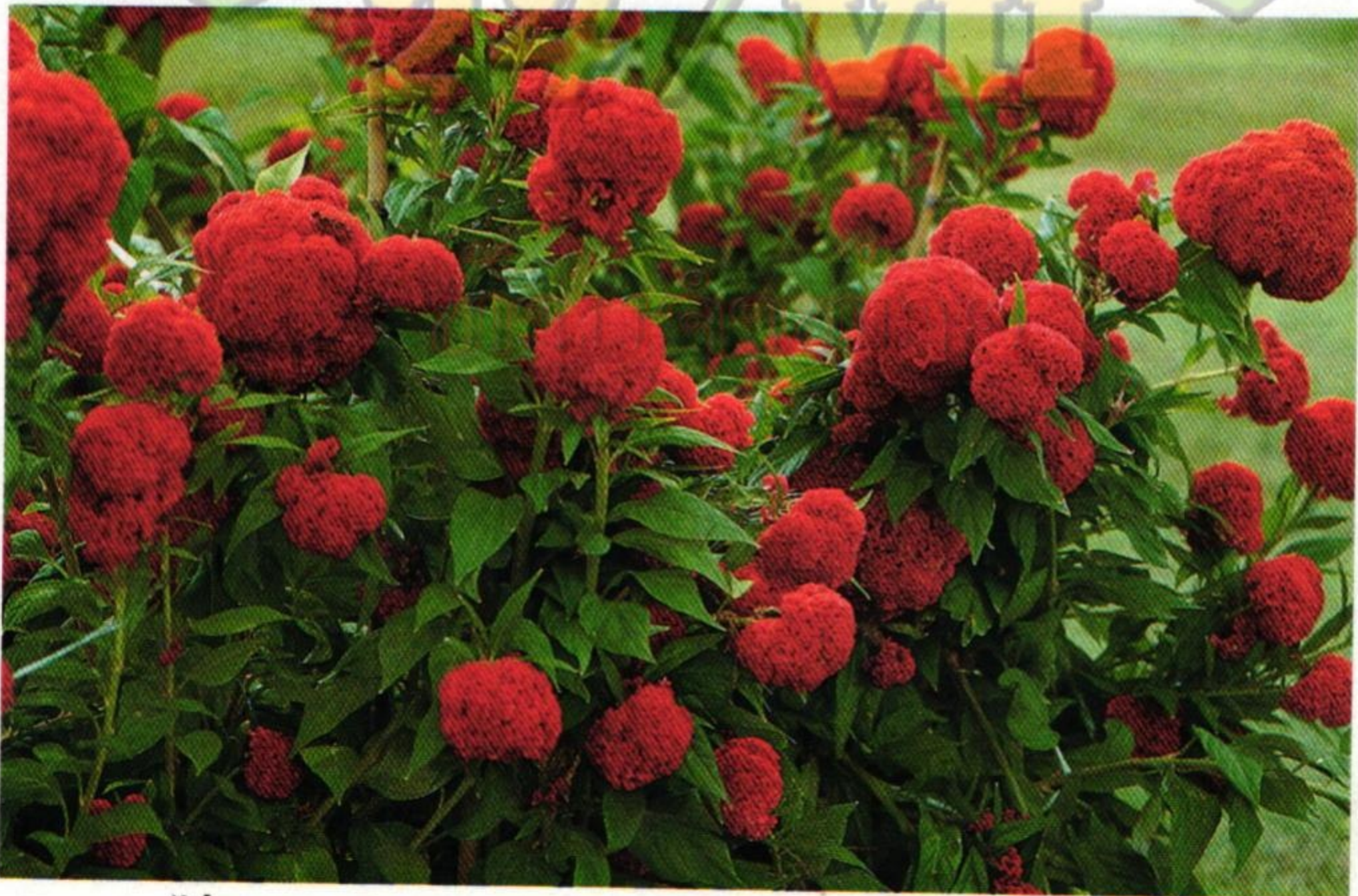
32. หงอนไก่ (Cock comb : Celosia argentea )

ลดเลี้ยวเที่ยวชมสุมาลย์ สาวหยุดนางแย้มแกมใบ