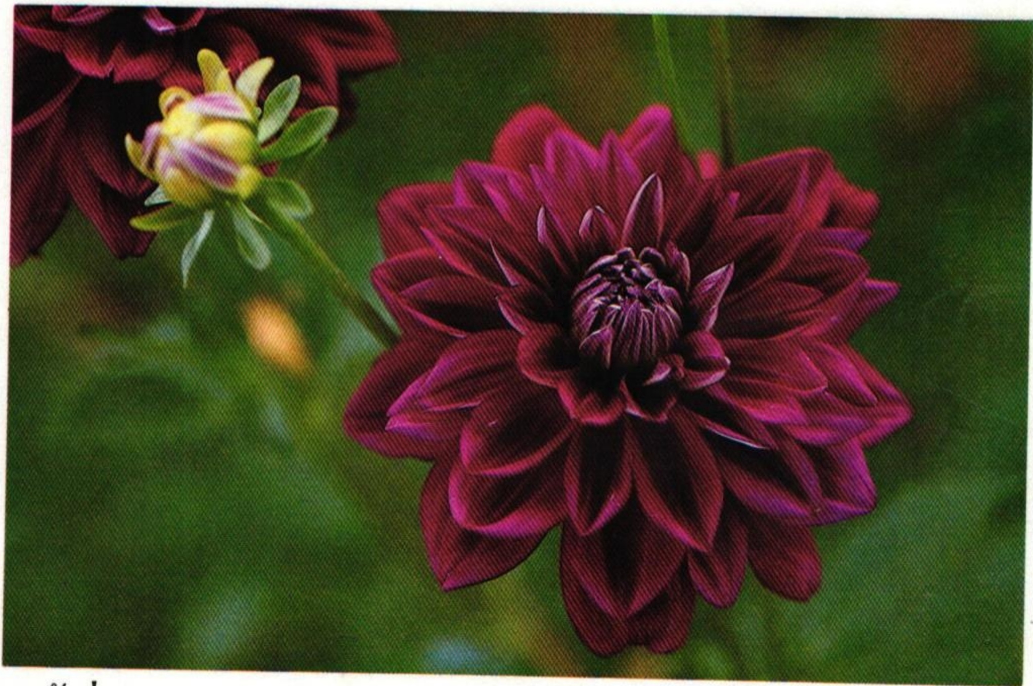
8. รักเร่ ( Dahlia sp. )