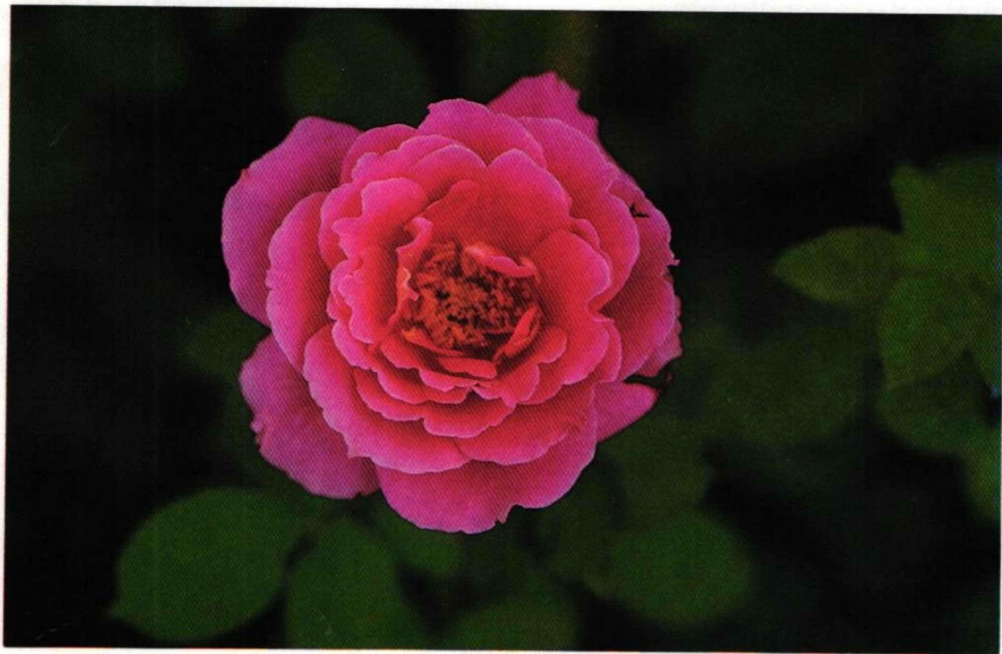
19. กุหลาบ (Rose : Rosa sp.)

พระโสมยงทรงเก็บกุหลาบเทศ ทำเทียมเลี่ยมลวดสอดคั่ว