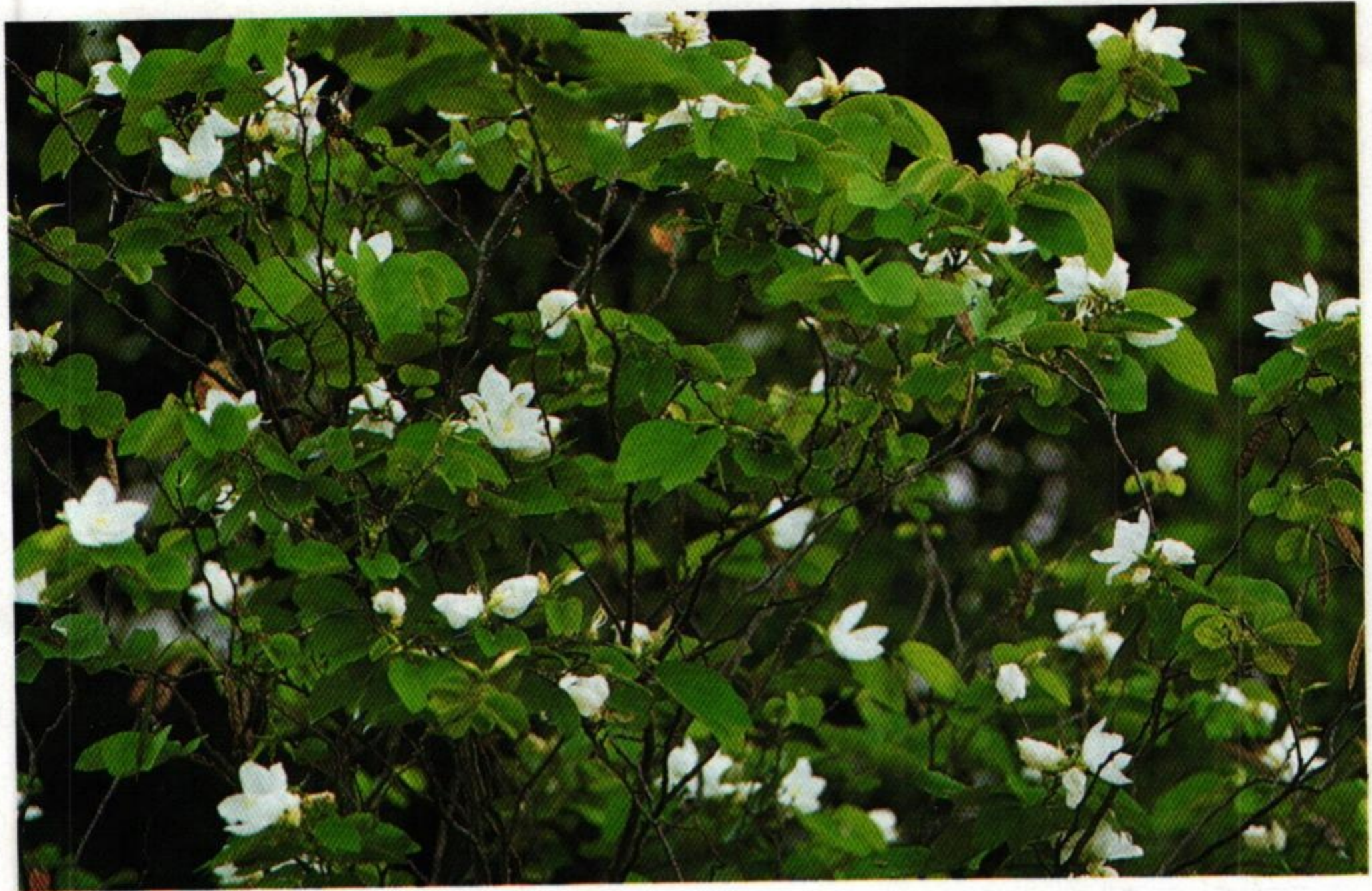
17. กาหลง ( Bauhinia acuminata )

กระทุงทองลงท้องในท้องธาร กาลิงจับกิ่งกาหลงเมียง