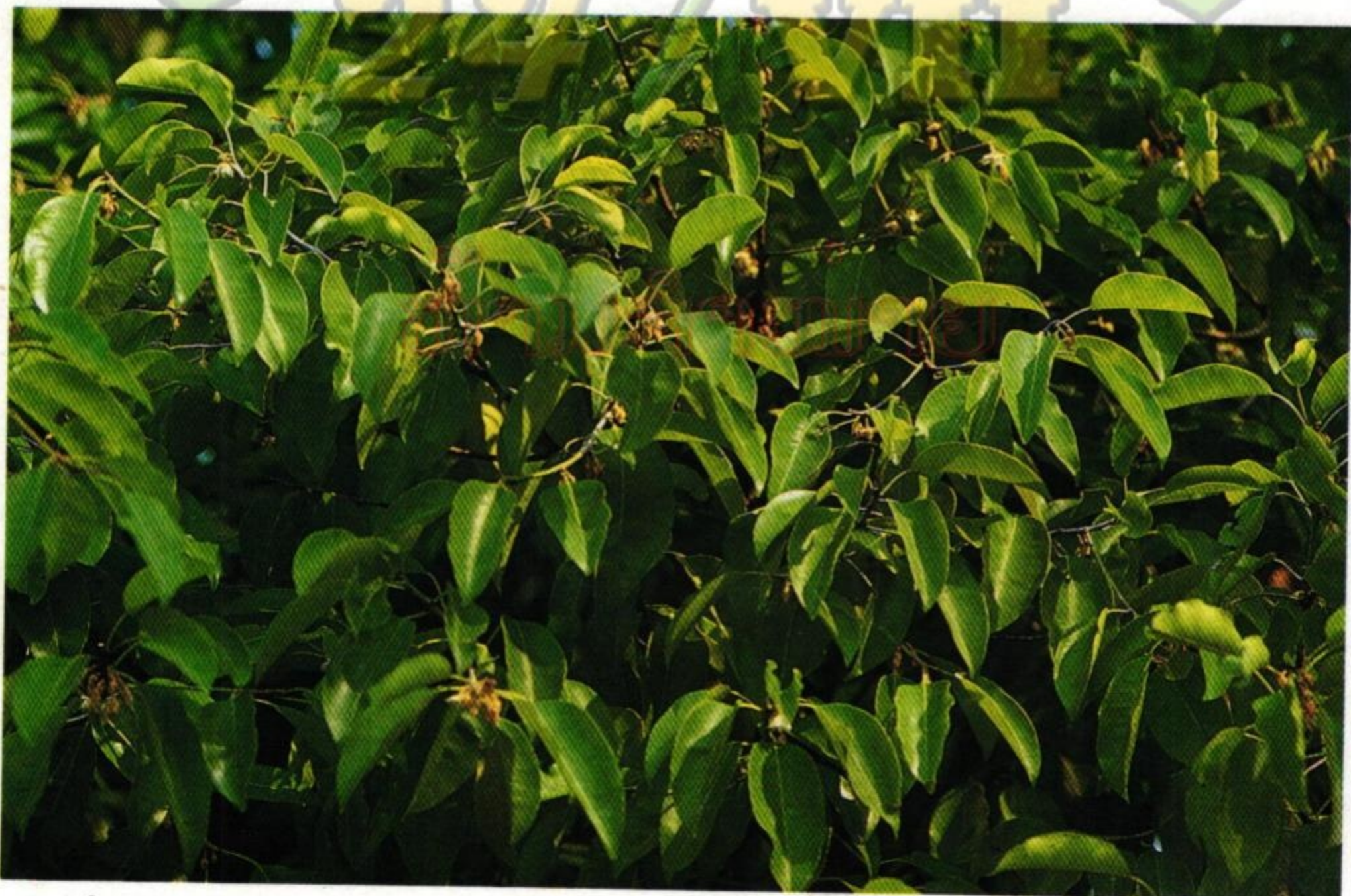
12. พิกุล (Bullet Wood : Mimusops elengi )