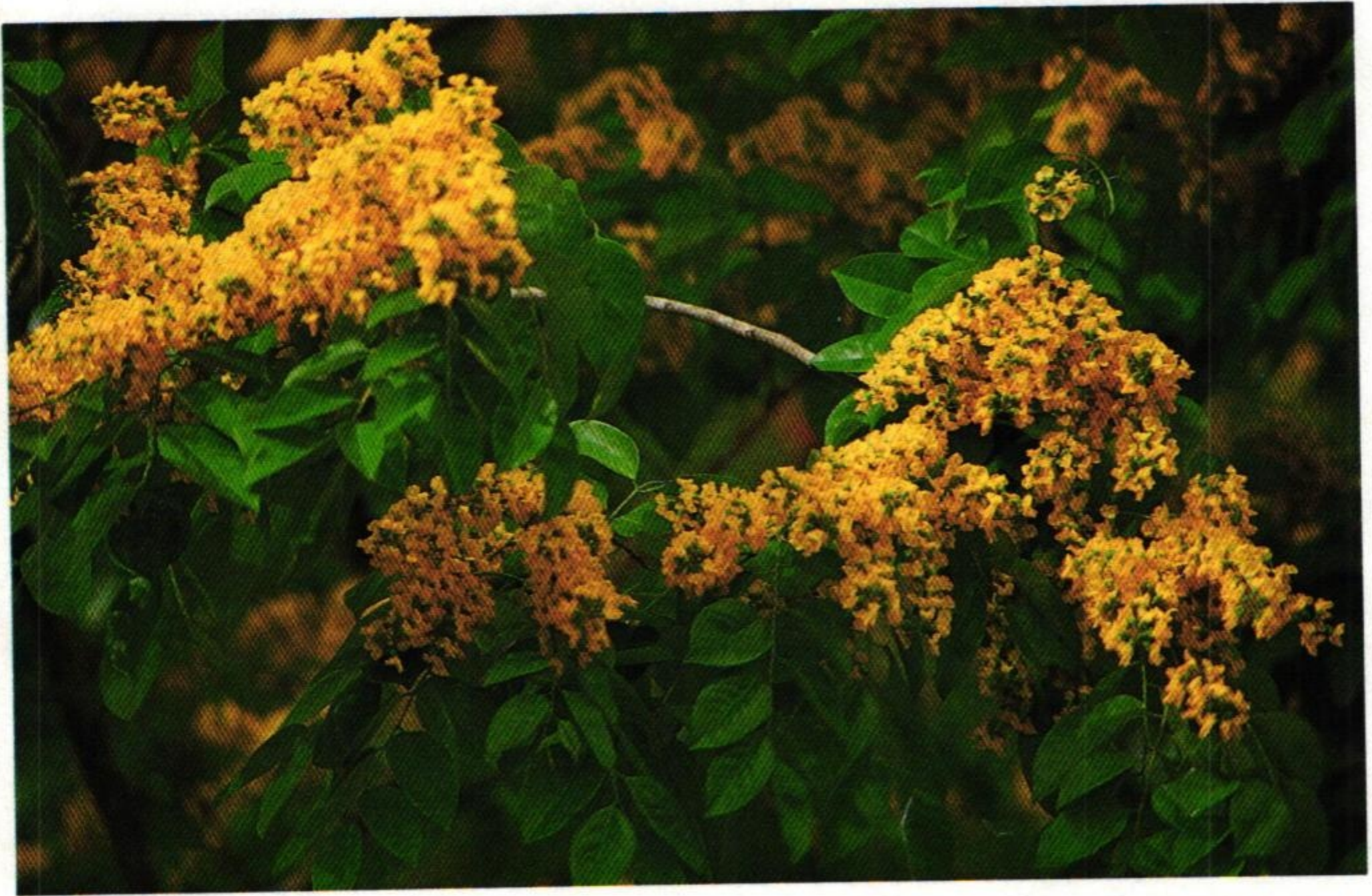
5. ประดู่ ( Pterocarpus indicus ) พื้เลียงเก็บดอกไม้ใส่พานทอง ประดู่ดอกดอกพวงร่วงลง

สมเด็จพระนเรศวรมหาราช (พ.ศ. 2155) ทรงพระประชวร มาถวายพระน้องต้องประสงค้ ลมส่งกลิ่นกลบตรหลบไป อิเหนา