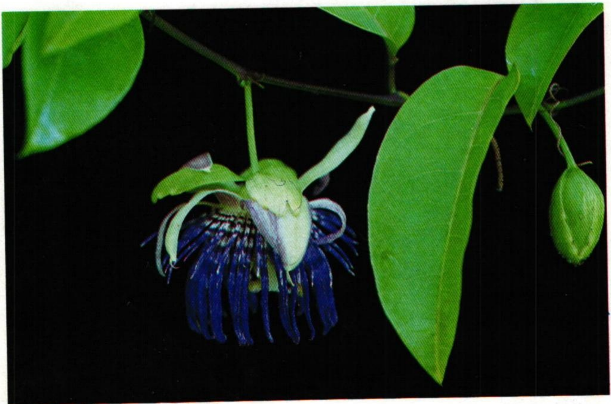
10. เถาวรส ( Passiflora laurifolia )

ทั้งสาวหยุดพุดแซมแกมยี่สุ่น เถาวรสสุคนธ์ปนขจร