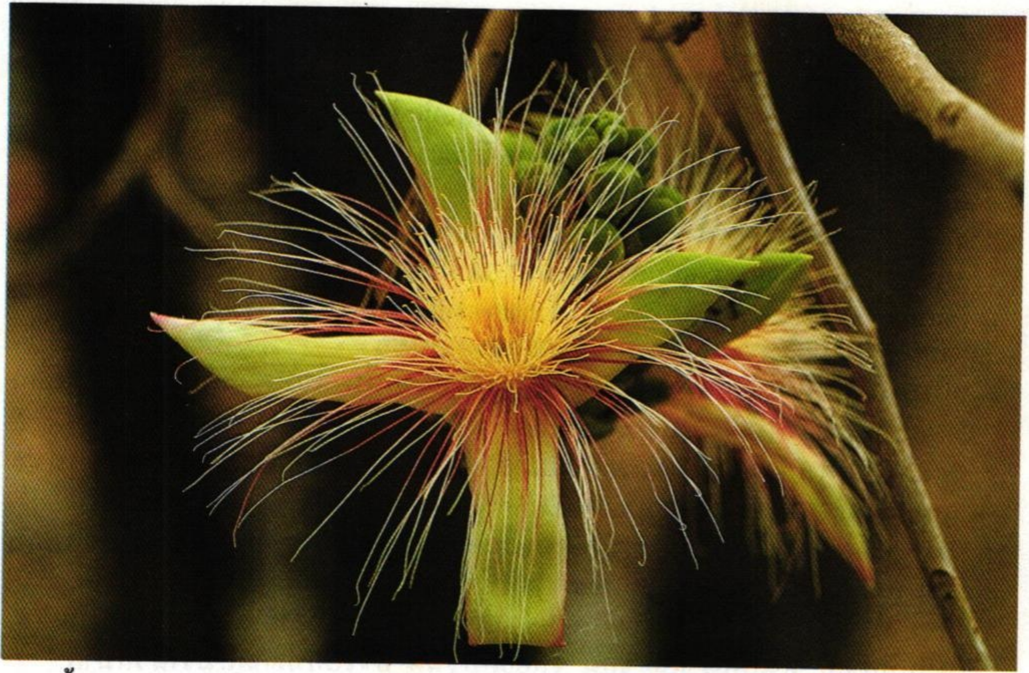
43. จีวป่า ( Bombax ceiba )

โอ้จีวป่าพาหนาวเมื่อคราวยาก แม้นจีวเป็นเซ่งงานเมื่อวานชื่น