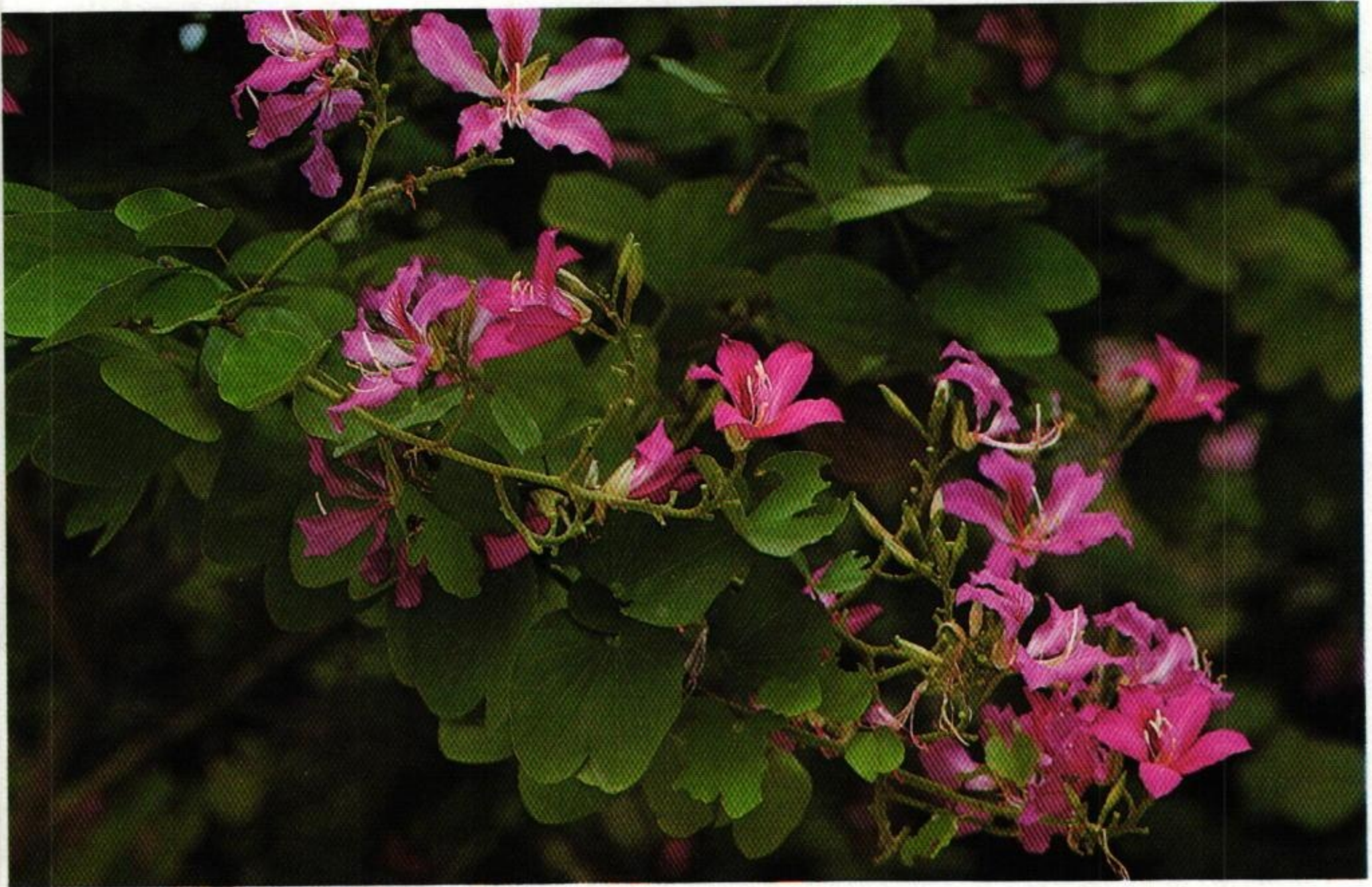
41. ชงโค (Purple Orchid Tree : Bauhinia purpurea )

พรางชมดอกดวงพวงผกา สาวหยุดพุดจีบปีบประยงค์