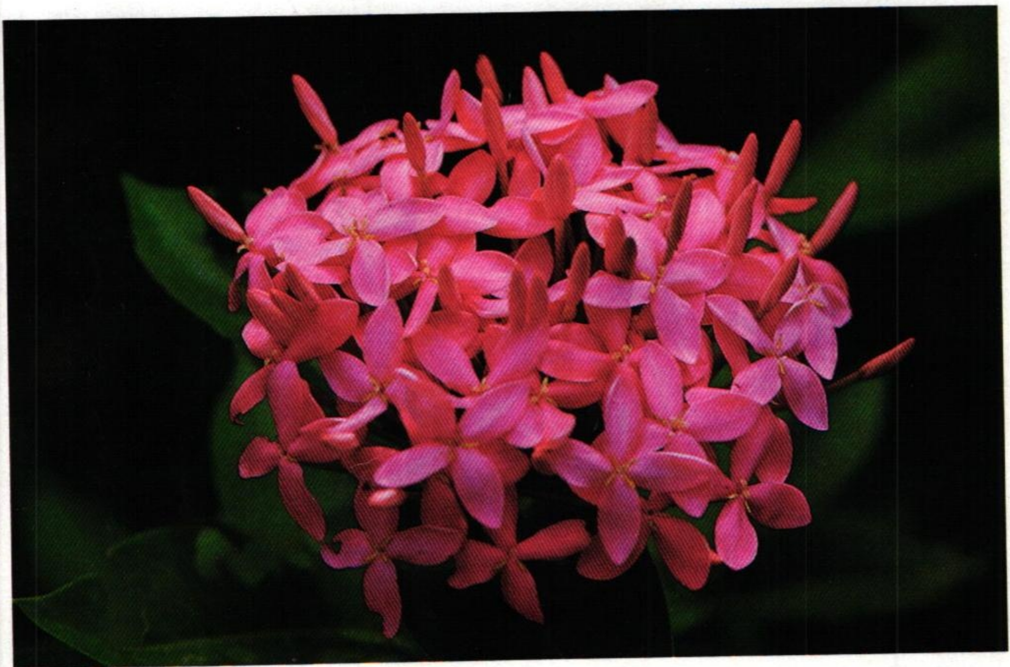
14. เข็ม ( Ixora sp.)

ต้นนางแย้มแกมดอกคิ่ง ดอกราชพฤกษ์ซีกไทโรไตร นัราศธารทองแดง