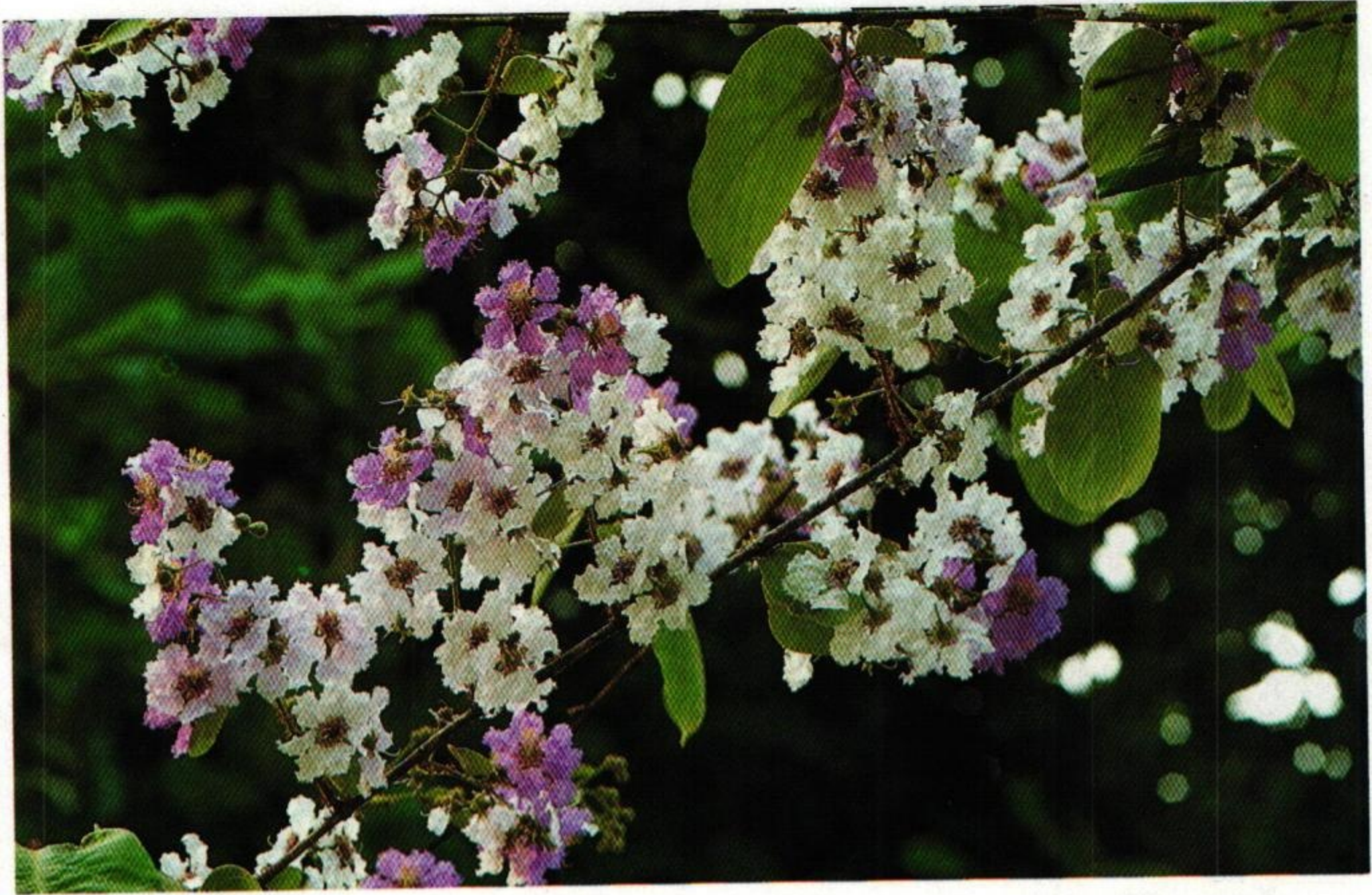
25. ตะแบก (Queen's Flower : Lagerstroemia sp.)

ชื่อนางช่างน้ำสาวหยุด พิกุลพวงแก้วเป็นแถวบาน