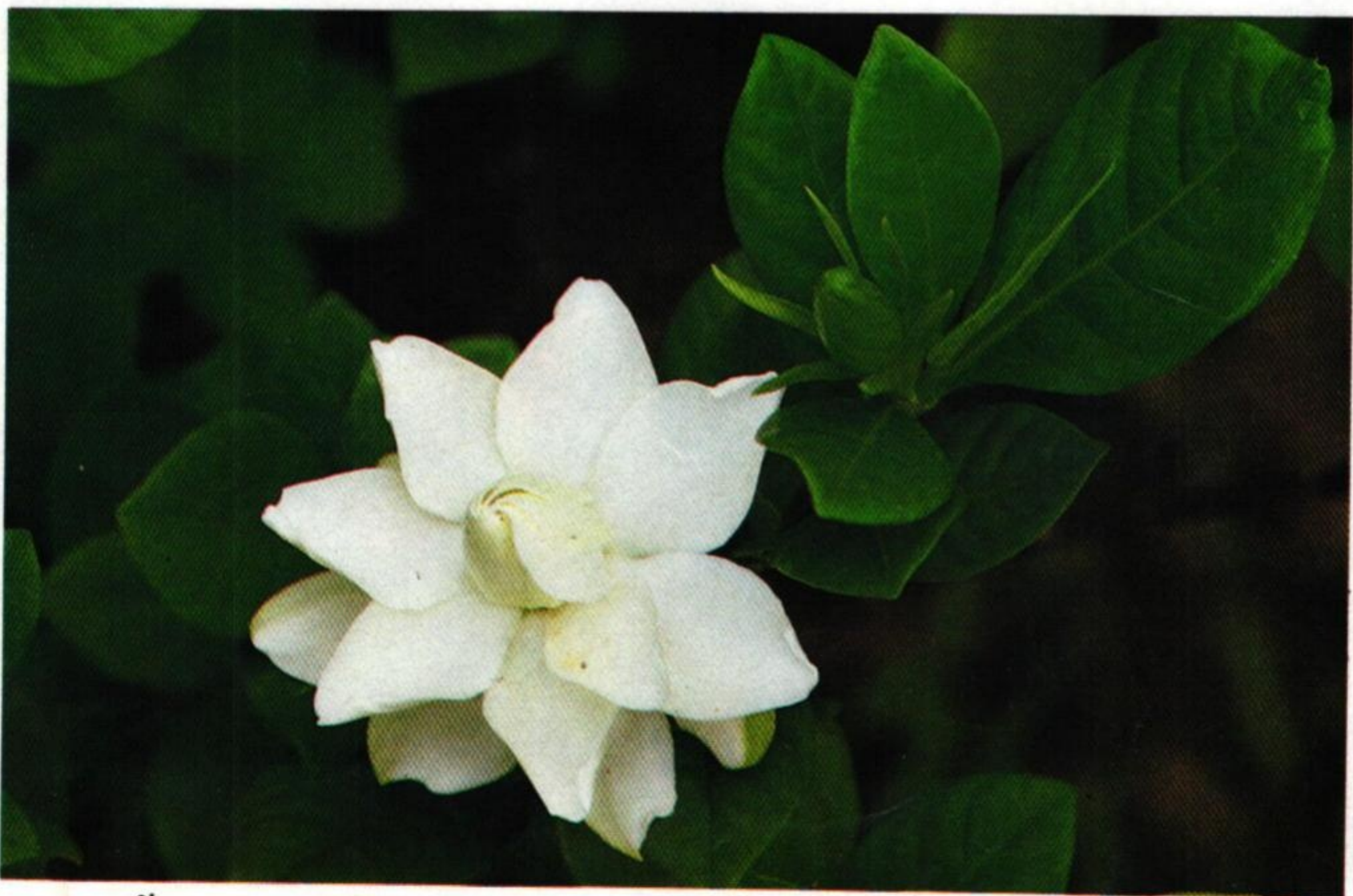
36 พุดซ้อน (Cape Gardenia : Gardenia jasminoides )

ช่อกระแบกสัดบุษย์พุดซ้อน จำปีมะลู่มะลิลา