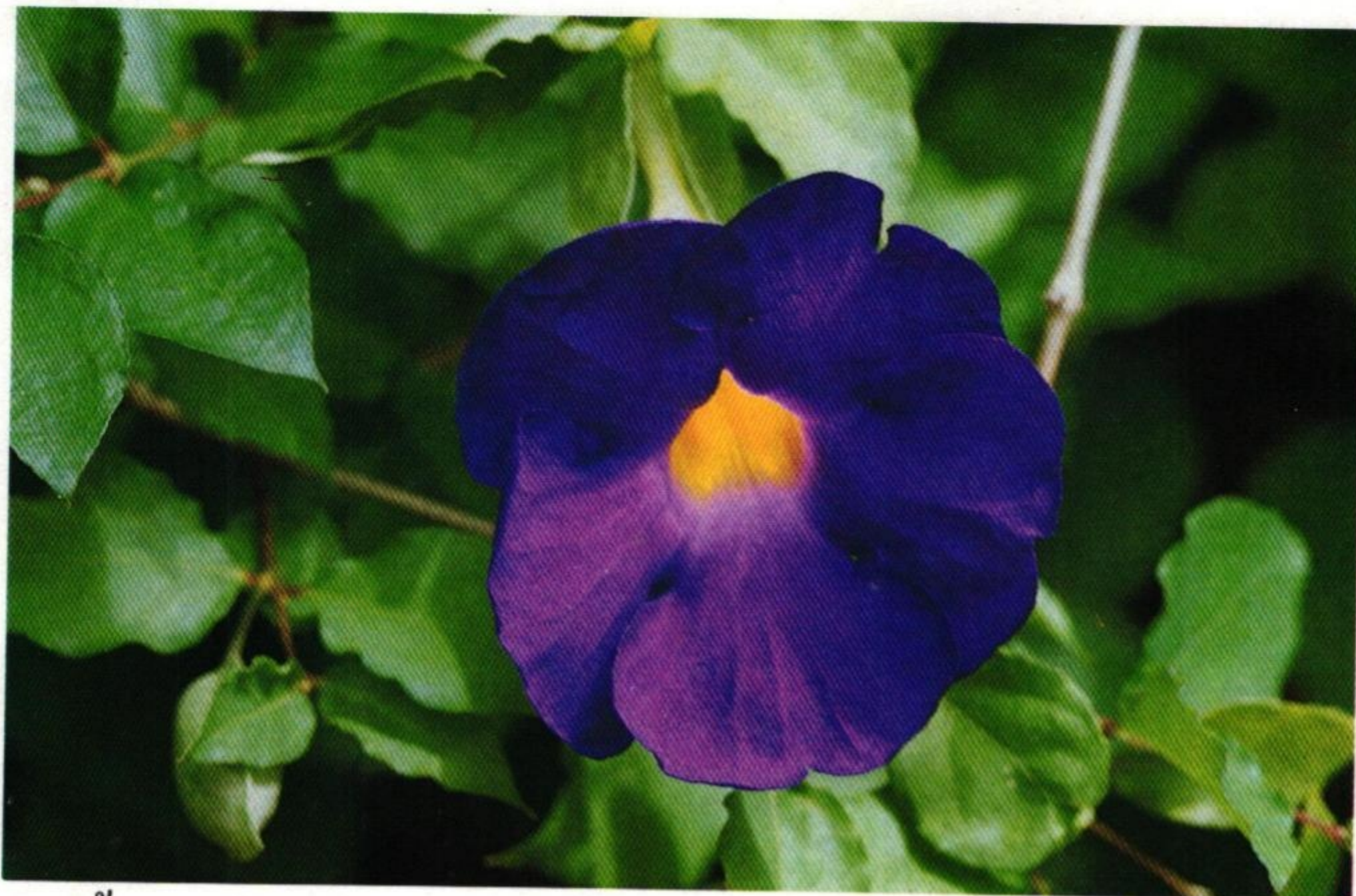
23. ช้องนาง (Bush Colckvine : Thunbergia erecta )