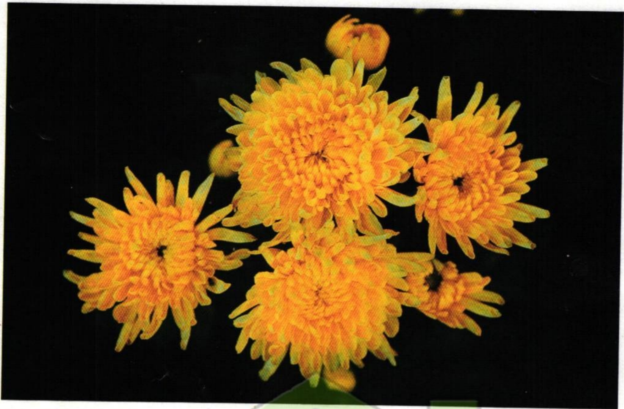
11. เบญจมาศ ( Chrysanthemum sp.)

พรางทูลภูวไนยให้เหนี่ยวน้อม เบญจมาศชาติบุษเป้งบาน