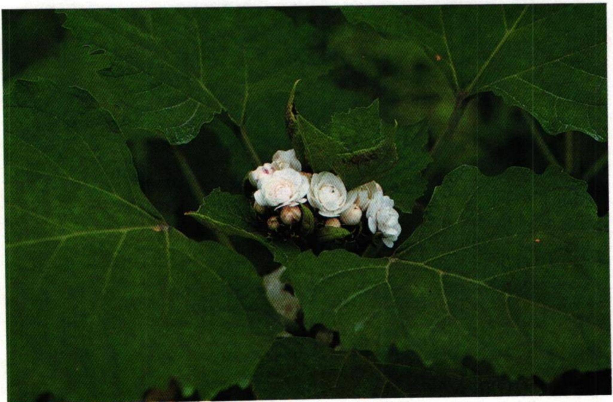
34. นางแย้ม ( Clerodendron fragrans )

กาหลงชงโคโยทะกา นางแย้มแย้มเป็นพู่ช่อ่มพวง