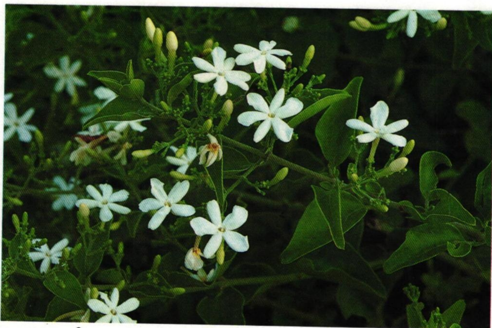
24. พุทธรชาติ (Star Jasmine : Jasminum multiflorum )

พื่นเตียนเลี่ยนลาดศิลาตาย สายหยุดพุทธรชาติมะลิวัน