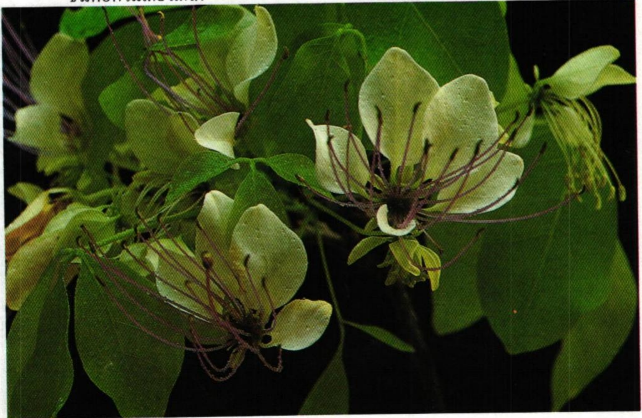
22. กุ่ม ( Crataeva erythrocarpa )

หอมหา ยากนา รวดเร็ว ลานสวาท เพื่อนไท้แพงทอง ลิลิตพระลอ