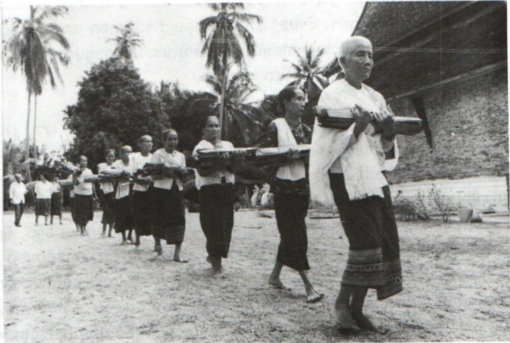
ວັດກາງ ບ້ານຫລິ່ງຊັນ

ແຕ່ຕົກມາເຖິງສະໄຫມຫນຶ່ງ, ນາຫລ້າເກີດມີພະຍາດຕິດແປດ ( ຂີ້ທູດ ) ແຜ່ລະບາດຈິ່ງພາກັນແຕກບ້ານຮ້າງເມືອງ; ສ່ວນຫນຶ່ງຍ້າຍໄປຕັ້ງບ້ານຢູ່ພະທາວ, ຕານປ່ຽວ, ນາແພງ ແລະ ອີກຈຳນວນກຸ່ມໃຫຍ່ກຸ່ມຫນຶ່ງ ໄດ້ຍ້າຍໄປຢູ່ກັບຊົນເຜົ່າປະສົມທີ່ບ້ານຫລິ່ງຊັນ. ຈຳນວນທີ່ໄດ້ໄປຢູ່ບ້ານຫລິ່ງຊັນນີ້ໄດ້ຮັບຄວາມຈະເລີນສີວິໄລທາງດ້ານຈິດໃຈຢ່າງໄວວາ, ເນື່ອງຈາກຄົນພື້ນເມືອງຢູ່ແຫ່ງນີ້ໄດ້ສ້າງວັດກຸປັດໃຈໄວ້ກ່ອນແລ້ວເຊັ່ນ : ມີບຸນສິນກິນທານ, ມີການຄົບງັນໃນຮີດຄອງປະເພນີຕ່າງ ໆ ໂດຍມີການອ່ານຫນັງສືນິທານວັນນະກຳໃຫ້ກັນຟັງ, ມີການຈ່າຍກອນຜະຫຍາຕໍ່ແຍ ກັນລະຫວ່າງບ່າວສາວ ( ແບບຕອບແກ້ ). ຈາກການຈ່າຍກອນຜະຫຍາຕໍ່ແຍກັນແບບປາກເປົ່າຢູ່ບ້ານຫລິ່ງຊັນນີ້ເອງ, ຈິ່ງກໍ່ໃຫ້ເກີດມີສຳນຽງ ຫລື ທີ່ມາຂອງ " ອັບງື່ມ " ໃນປັດຈຸບັນ. ໃນສະໄຫມນີ້ຢູ່ທາງວັດກໍ່ມີນັກເທດລຳໃນນິທານຊາດິກຕ່າງ ໆ ປະ ເພດຮ້ອຍກອງ ຫລື ຮ້ອຍແກ້ວໂດຍມີຈັງຫວະ ຫລື ທຳນອງທີ່ຄົງຕົວ ແລະ ແນ່ນອນ, ເຮັດໃຫ້ສັງຄົມຢູ່ເຂດຫລິ່ງຊັນໃນສະໄຫມນີ້ມີຄວາມປະທັບໃຈ ແລະ ຮູ້ສຶກໃນຄວາມ ບັນເທີງຢ່າງສຸດຊຶ້ງ. ພວກອ້າຍຈານ, ອ້າຍທິດ ແລະ ອ້າຍຊຽງທີ່ສຶກອອກຈາກວັດໄປແລ້ວ, ກໍ່ຍັງຄົງອົມເອົາສຽງຄໍນັກເທດອອກມານຳ, ເພື່ອມີຈຸດປະສົງ ຈະໄດ້ອ່ານຫນັງສືນິທານວັນນະກຳ, ນິທານຄຳ ກອນໃຫ້ຄົນອື່ນຟັງໃນຍາມບຸນປະເພນີຕ່າງ ໆ ເຊັ່ນ: ງັນເຮືອນດີເປັນຕົ້ນ. ຄົນຈຳນວນສ່ວນຫລາຍຢູ່ ເຂດຫລິ່ງຊັນນີ້ໄດ້ຮັບພູມຄວາມຮູ້ດ້ານການສຶກສາມາຈາກວັດຄືກັບແຫ່ງອື່ນ ໆ ໃນລາວເຊັ່ນ : ພຸດທະສາດ, ວັນນະຄະດີບວກ ກັບພູມປັນຍາຊາວບ້ານ ທີ່ມີເງື່ອນໄຂຊອກມາຫາໄດ້.