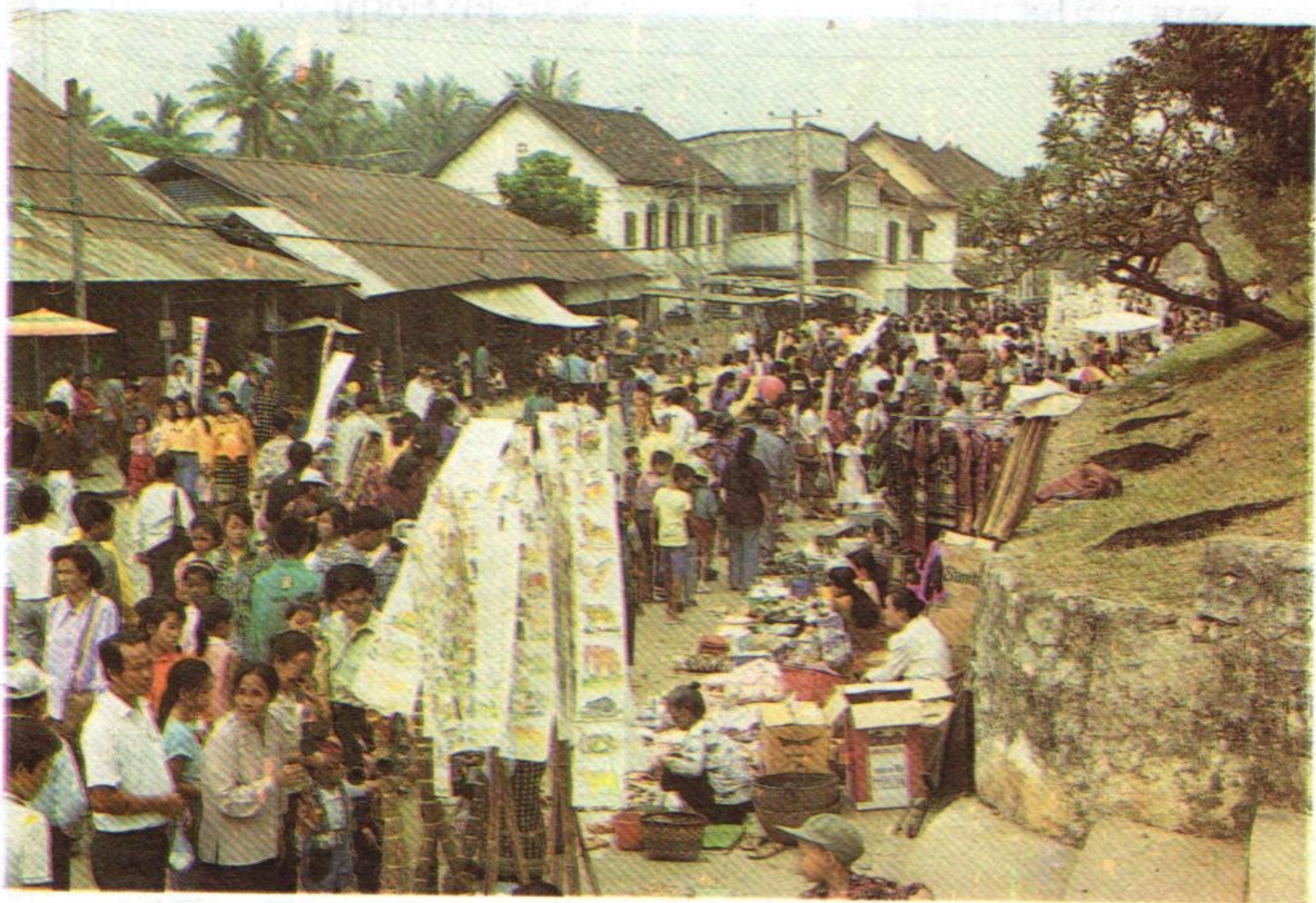
ຕະຫລາດນັດ 1996 ຖະໜົນເສັ້ນກາງ ວັດທາດ-ລາດແລງ