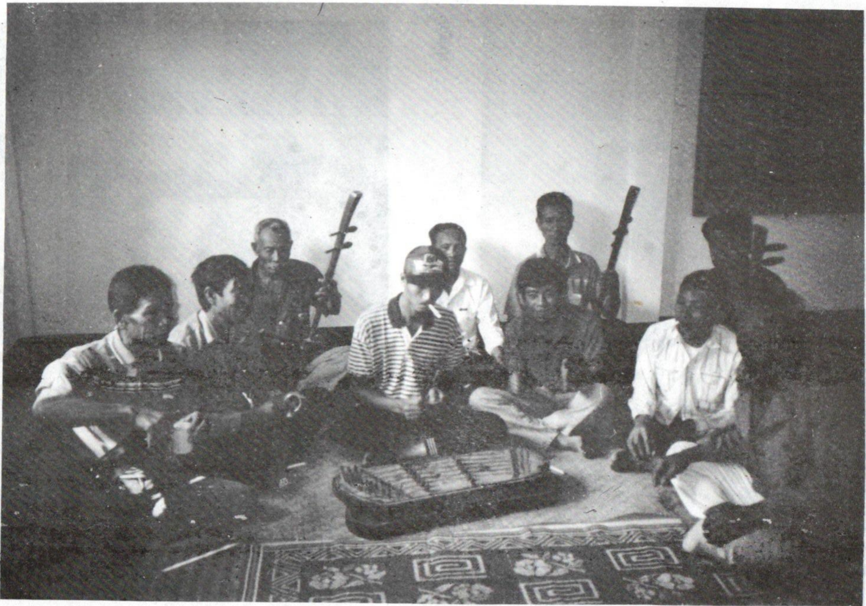
(12-13) ການຄົບຮ້າງ - ຂອງເຖົ້າແກ່ ບ້ານຂຽງ - ເງິນ ປີ 1994