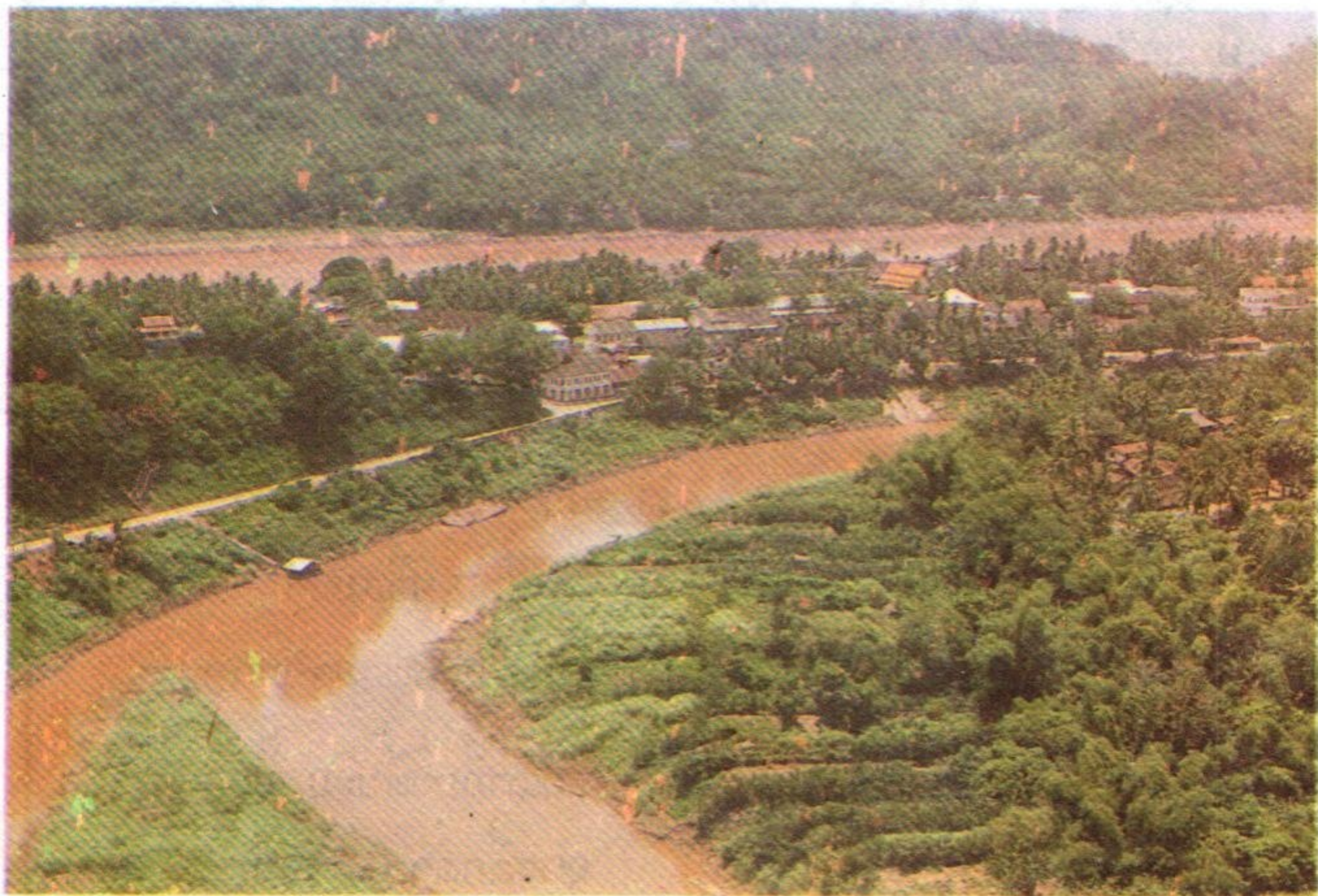
ທ່າປ່າເຜືອນ 1994