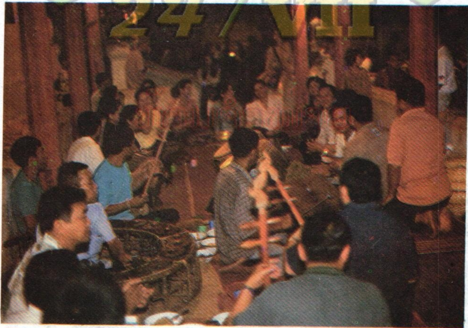
ຽນວັດໃຫມ່ ໂອກາດ ສົງພະບາງ 1996