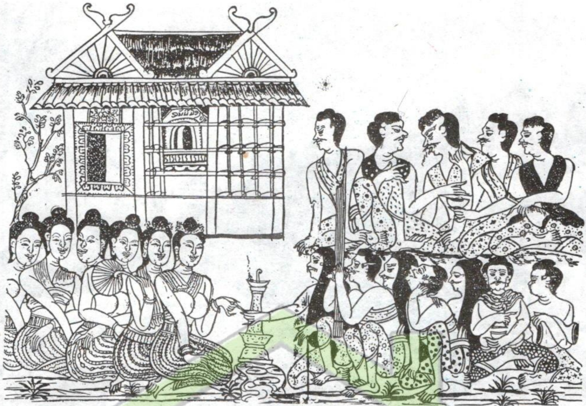
ລົງຂ່ວງຽນ ຈາກກຽບແຕ້ມເມືອງນານ ຊຸມປີ 1890