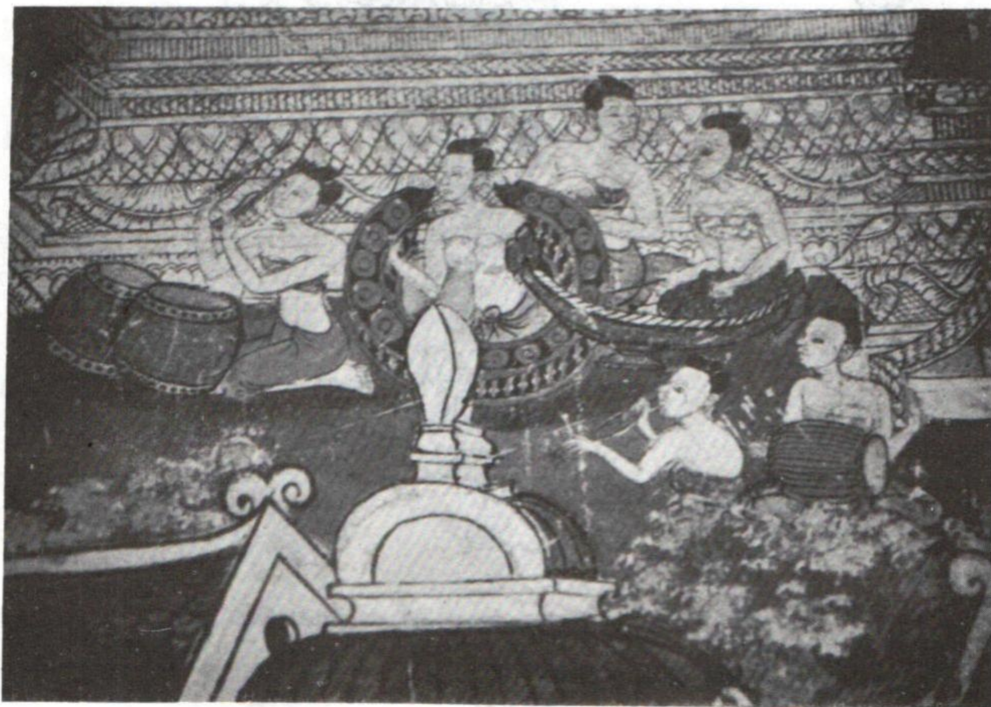
ພິນພາດ ຝາພະຫນັງວັດອນໂມ.( ຊຽງເງິນ )