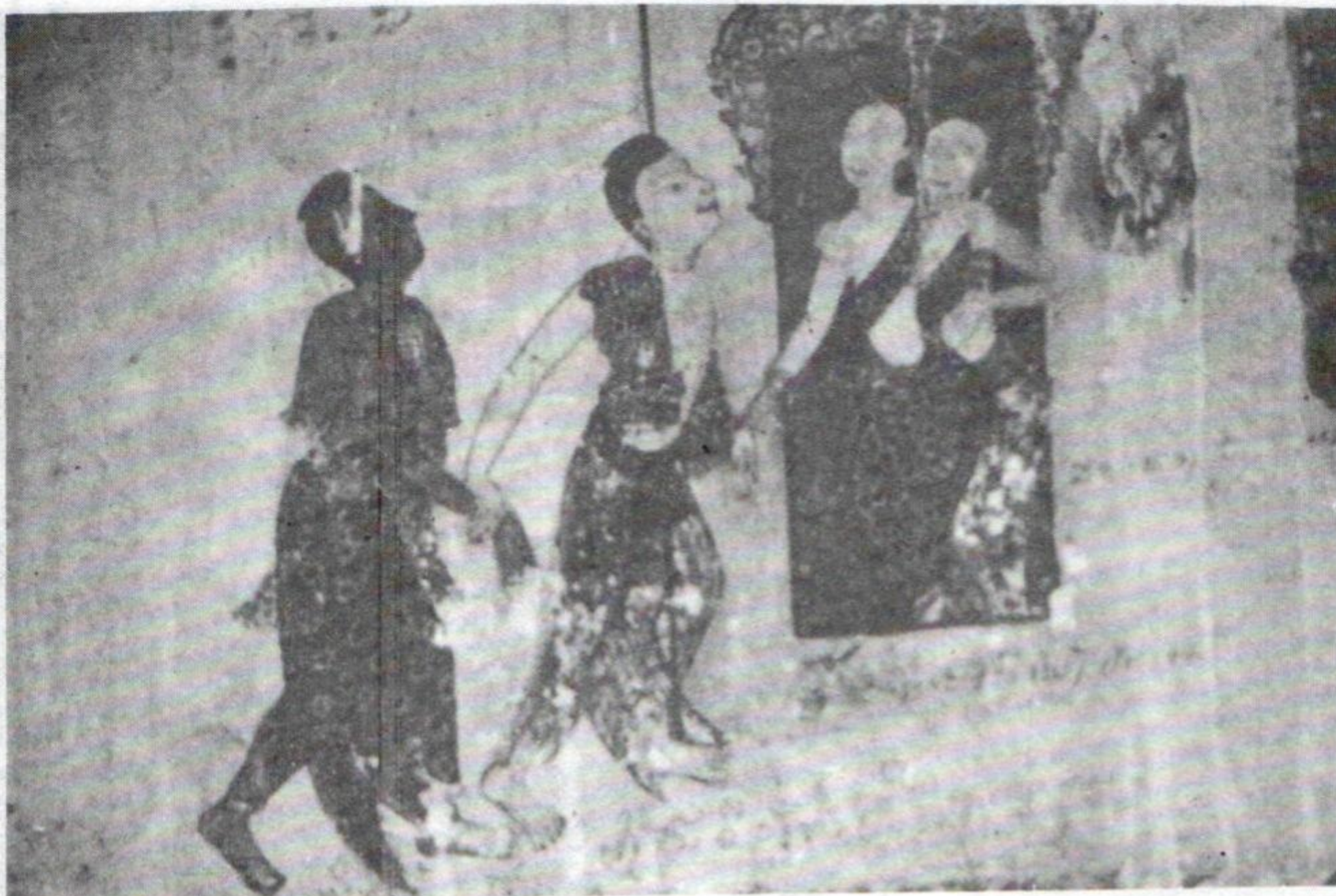
ແອ່ວສາວແບບບູຮານ ຮູບແຕ້ມຝາພະຫນັງ ວັດປ່າຮວກ