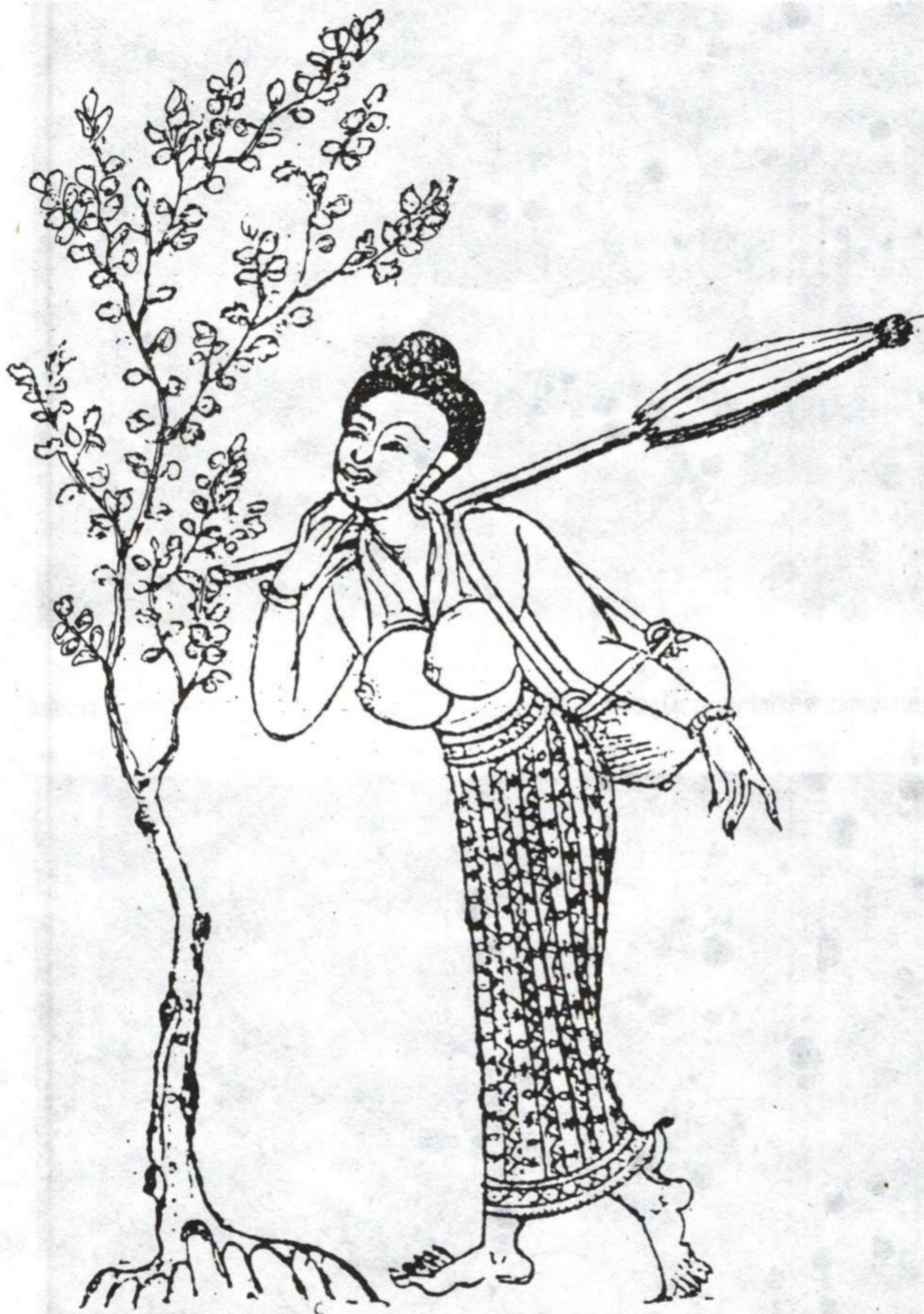
Jeune fille Laotienne en promenade d'après un dessin indigène.