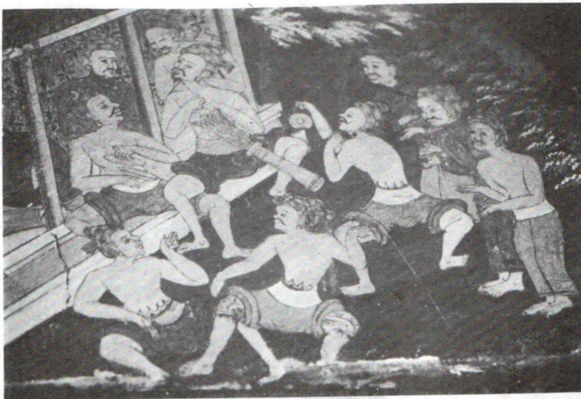
ລາຍກອງຫາງ ຮູບແຕ້ມ ຝາພະໜັງ ວັດດອນໂມ