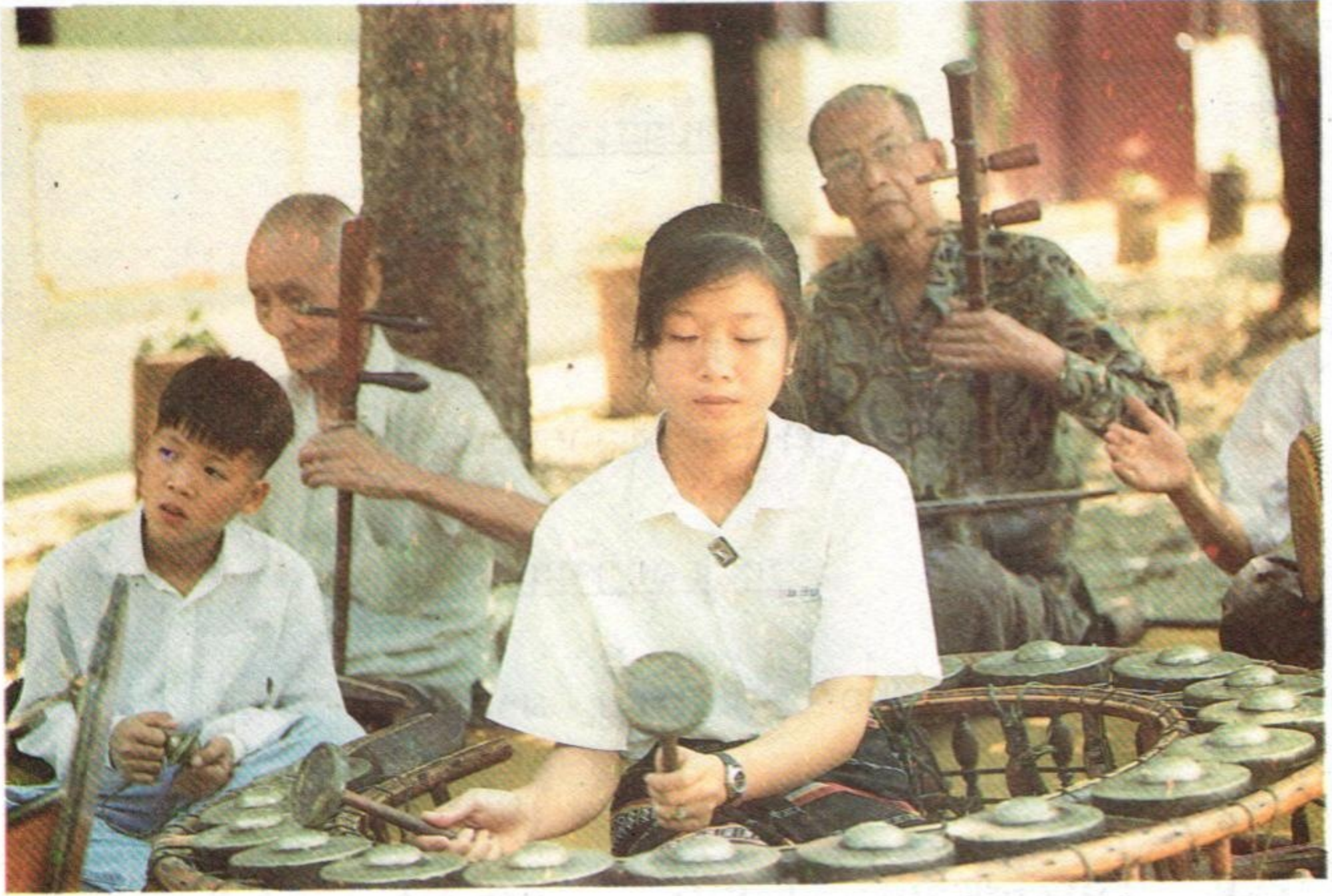
ວິງເສບຄອບຄົວບຸບຜາ ( ຖ່າຍທອດ-ສືບທອດ )