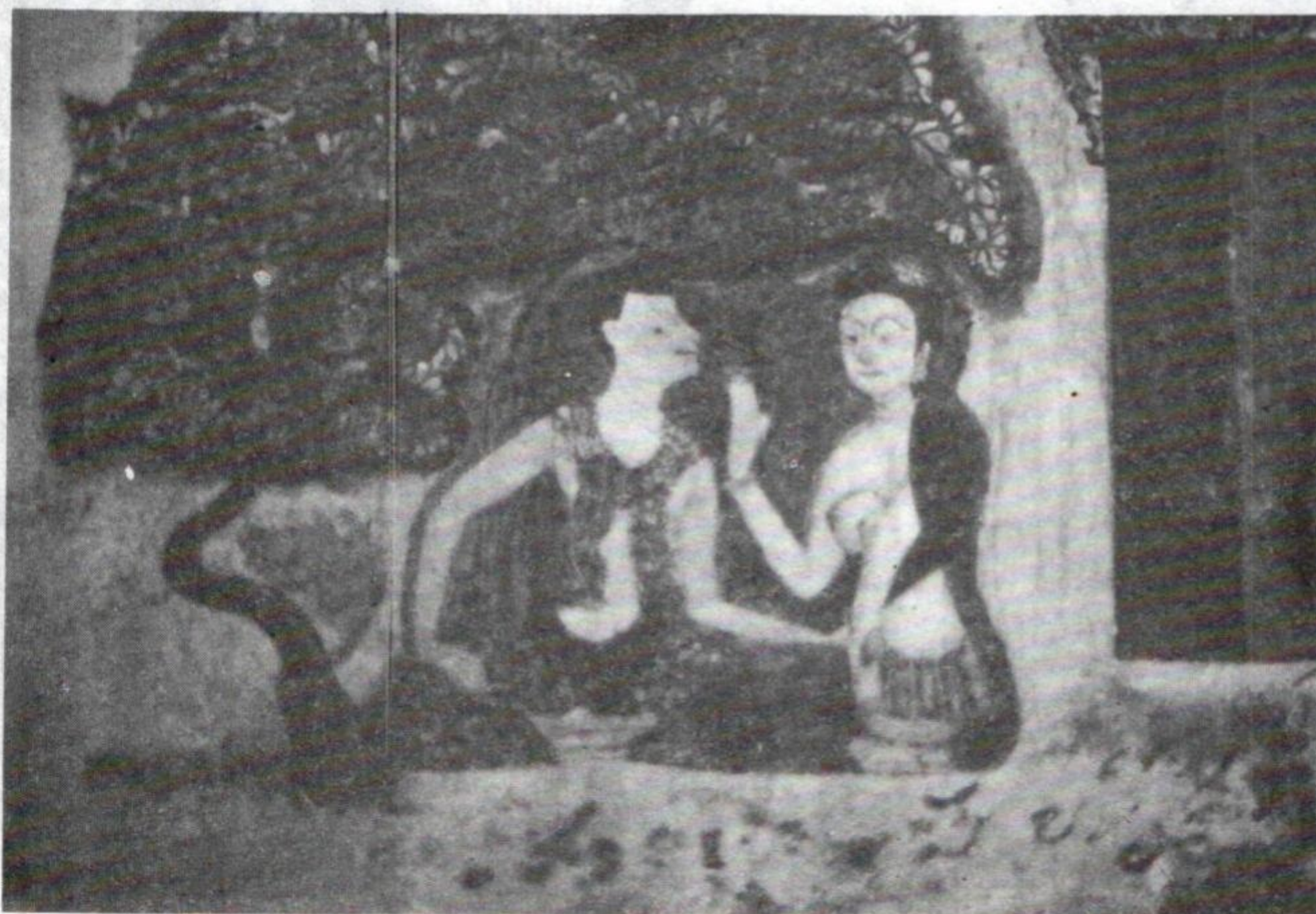
ຂໍ້ຂອດຮັກ ຮູບແຕ້ມ ຝາພະຫນັງ ວັດປ່າຮວກ