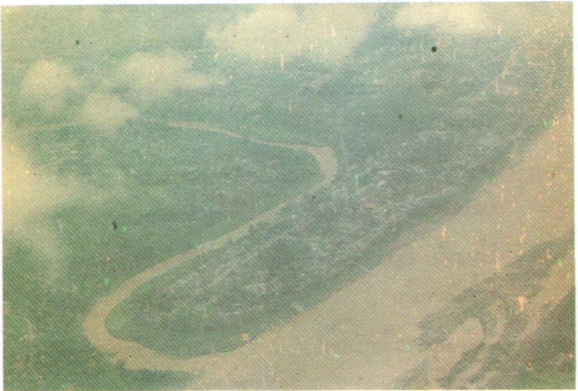
ຫລວງພະບາງ ປີ 1998