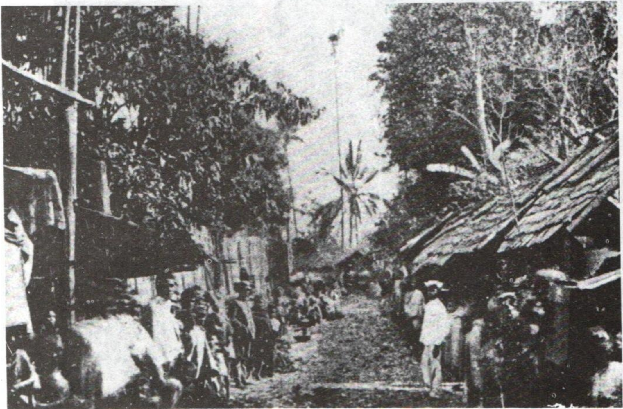
ຖະຫນົນເສັ້ນກາງທີ່ລາດແລງ ຊຸມປີ 1800