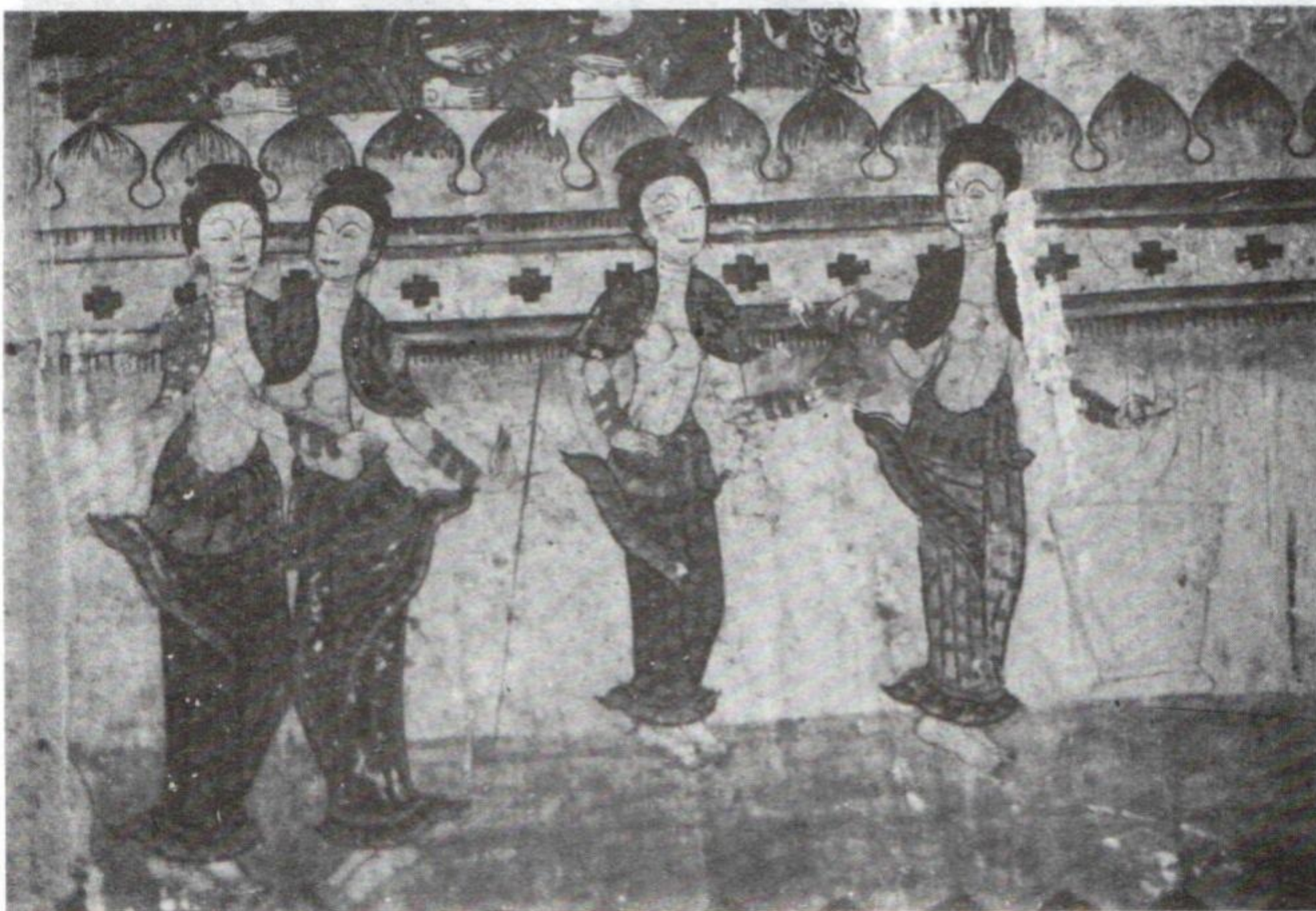
ສາວສະໜົມ ໃນວັງ ຮູບແຕ້ມ ຝາພະໜັງວັດປ່າຮວກ