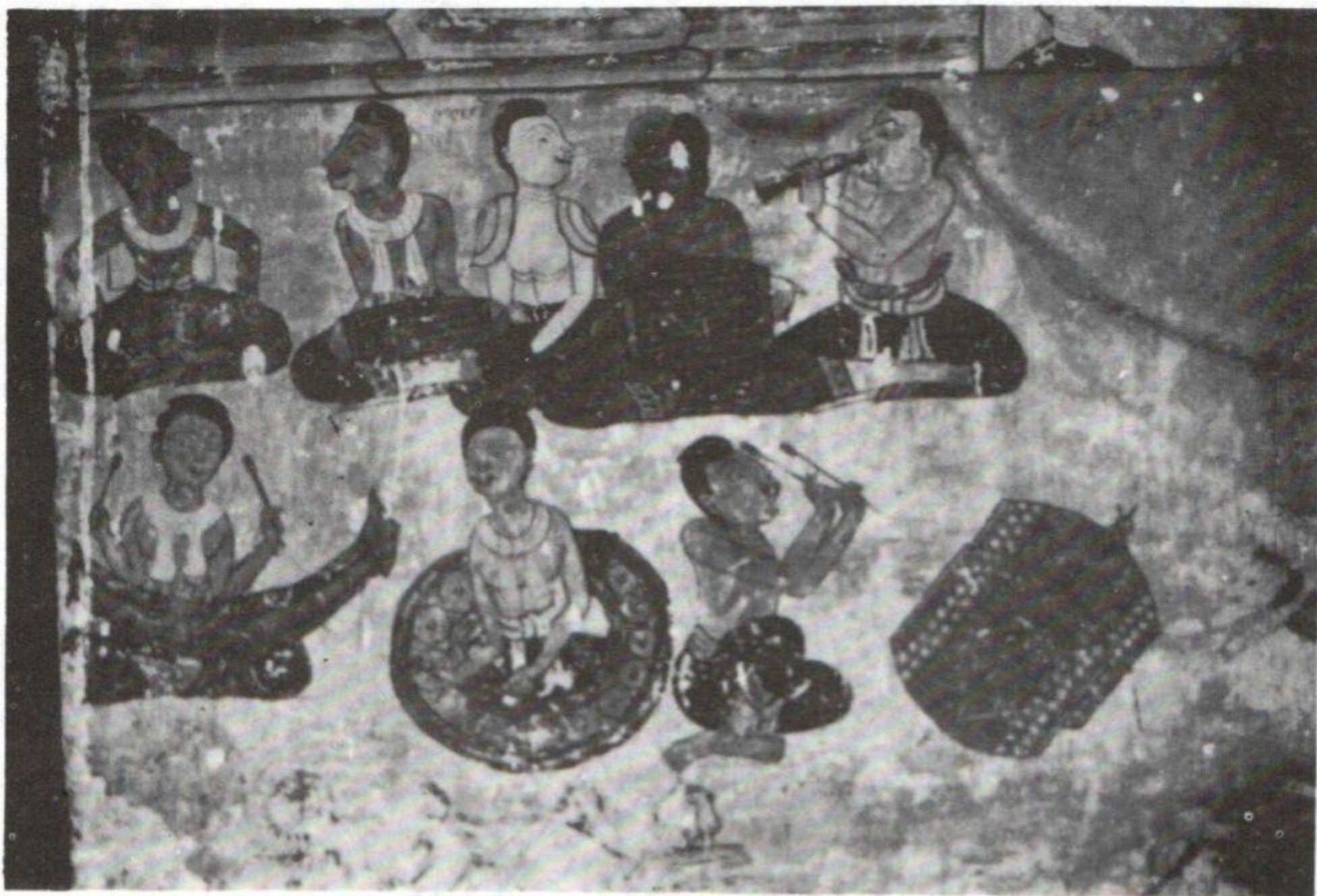
ວິງພິນພາດ ຈາກຝາພະຫນັງວັດປ່າຮວກ