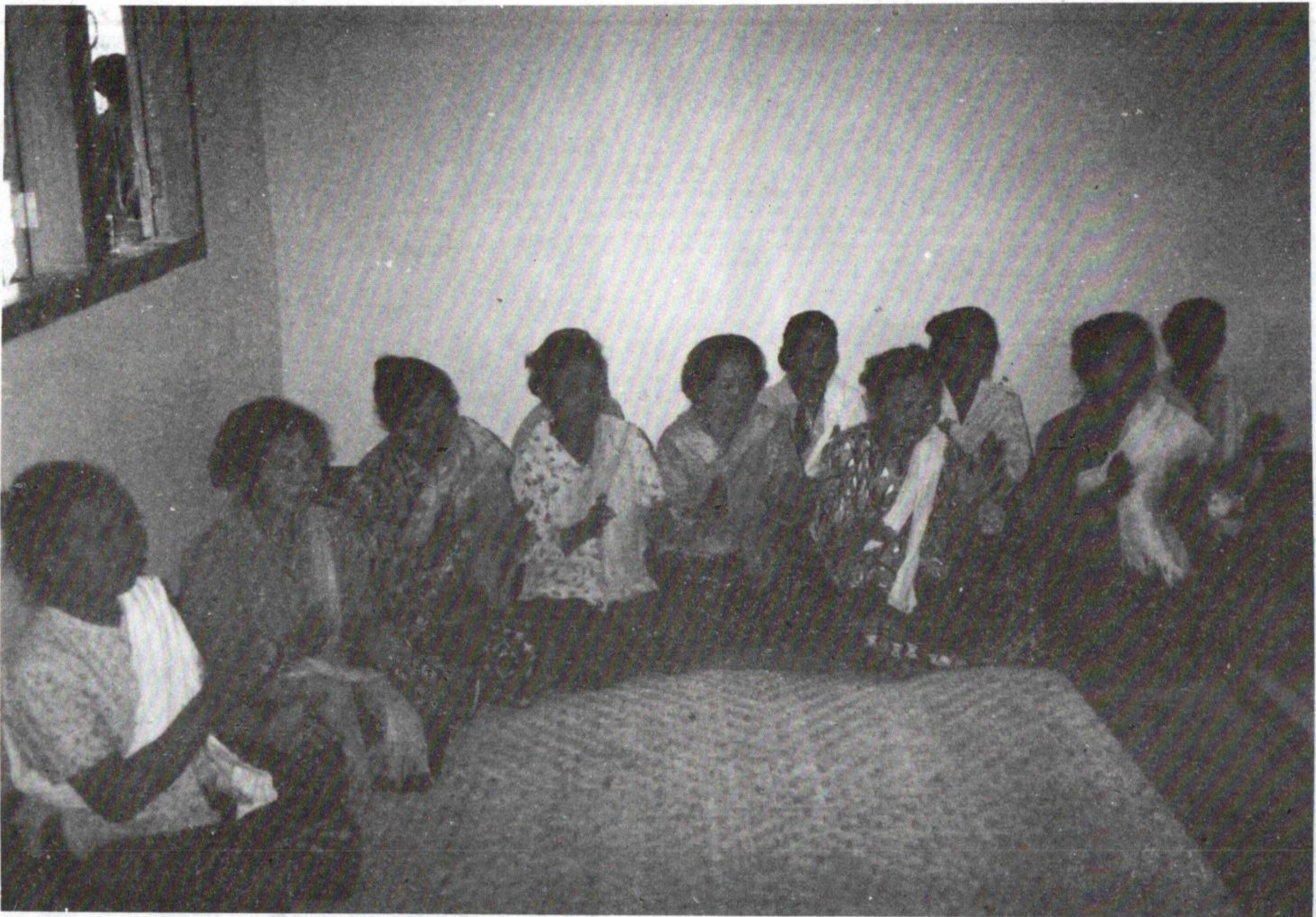
(12-13) ການຄົບຮ້າງ - ຂອງເຖົ້າແກ່ ບ້ານຂຽງ - ເງິນ ປີ 1994