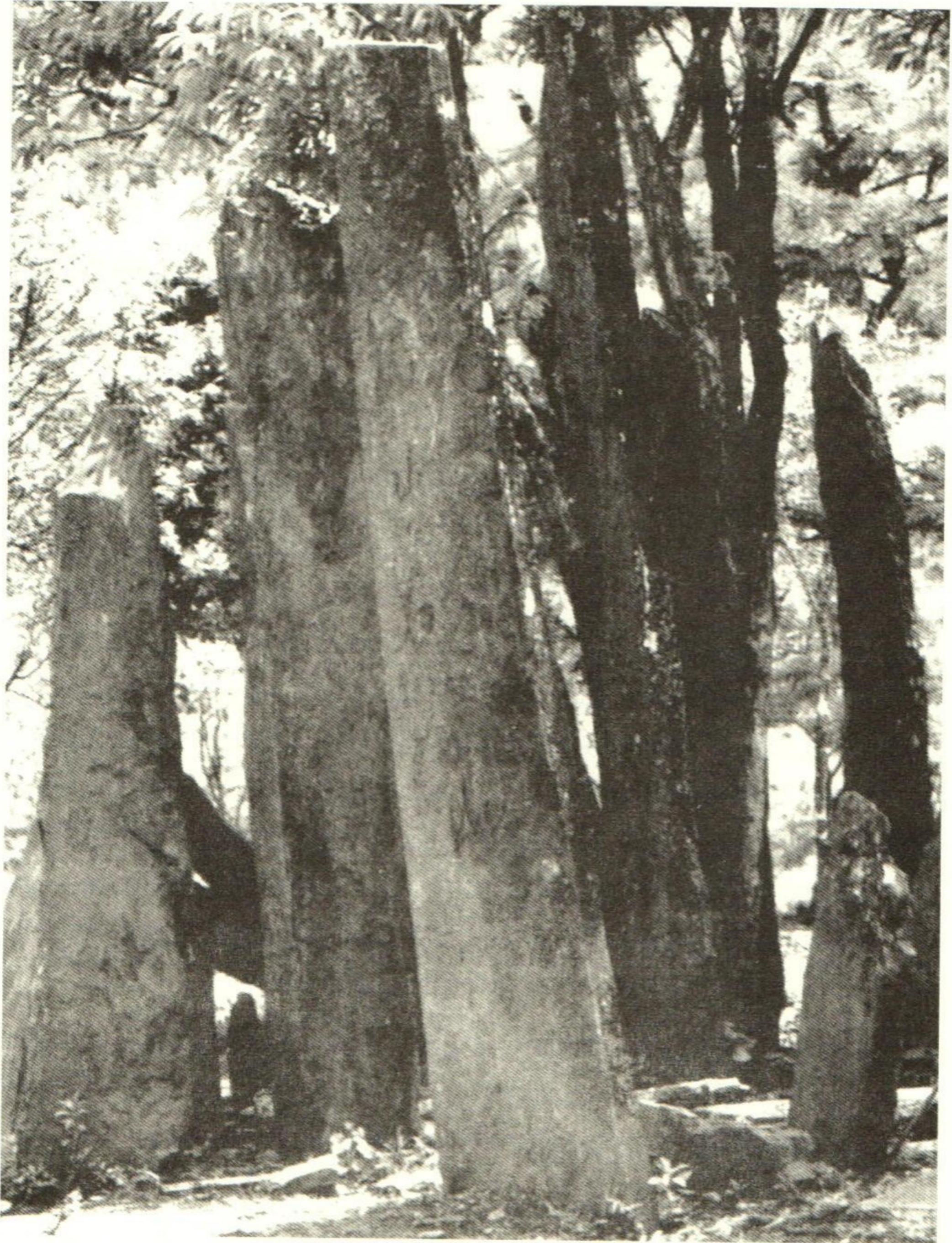
ຫີນຕັ້ງກຸ່ມໃຫຍ່ຢູ່ຕາມເສັ້ນທາງປ່າຄາ-ປ່າແລ ແຂວງຫົວພັນ ສືບເນື່ອງຈາກຍຸກທ້າວເຈືອງ