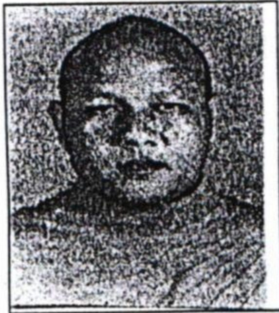
ພຣະອາຈານ ພູມິພອນທລາສິນ