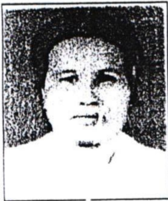
ແມ່ບົວເງິນ ພູມມະສັກ ບ້ານສາຍລົມ