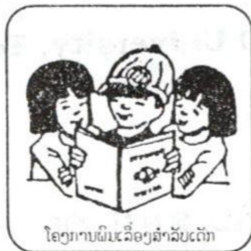
ໂຄງການພິມເລື່ອງສຳລັບເດັກ

ສະມາຄົມສົ່ງປຶ້ມຮູບໃຫ້ເດັກນ້ອຍລາວ ແຫ່ງຍີ່ປຸ່ນ