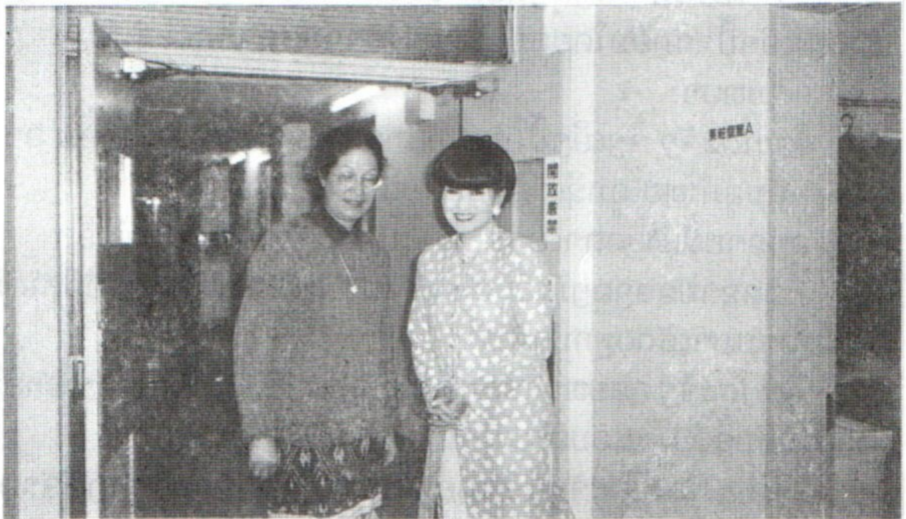
ນັກຂຽນ ແລະ ຜູ້ແປ ໃນໂອກາດພົບພໍ້ກັນ ກຸມພາ 1999 ທີ່ ສະຖານີ NHK , ໂຕກຽວ

ຂໍໃຫ້ເດັກນ້ອຍທຸກຄົນ ຮັບຮູ້ວ່າ ໃນໂລກນີ້ ຍັງມີຄົນ ຄື ຄືໂຣຢາມາງີ ເຕັດຊີໂກະ ຢູ່ຫລາຍຄົນ, ເຂົາເຈົ້າເປັນຜູ້ອຸທິດຕົນ ເພື່ອເຮັດໃຫ້ເດັກນ້ອຍ ເປັນຢູ່ຢ່າງຜາສຸກ, ໂດຍສະເພາະ ເດັກນ້ອຍທີ່ຕ້ອງການຄວາມຊ່ອຍເຫລືອ ປະສົບຄວາມລຳບາກ ຢູ່ໃນປະເທດ ທຸກຍາກຂາດເຂີນ ແລະ ມີເສິກສິງຄາມ.