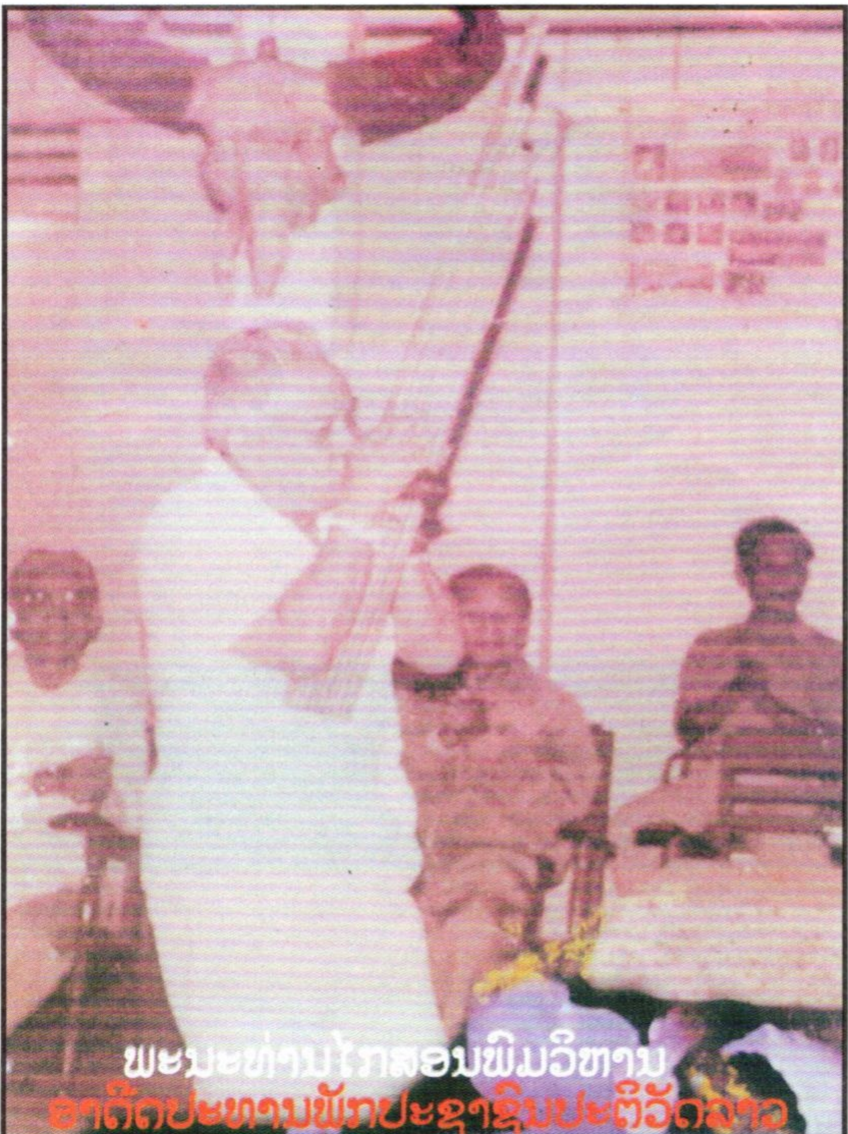
ພະນະທ່ານໂກສອນພິມວິຫານ ອາດີຕປະທານພັກປະຊາຊົນປະຕິວັດລາວ