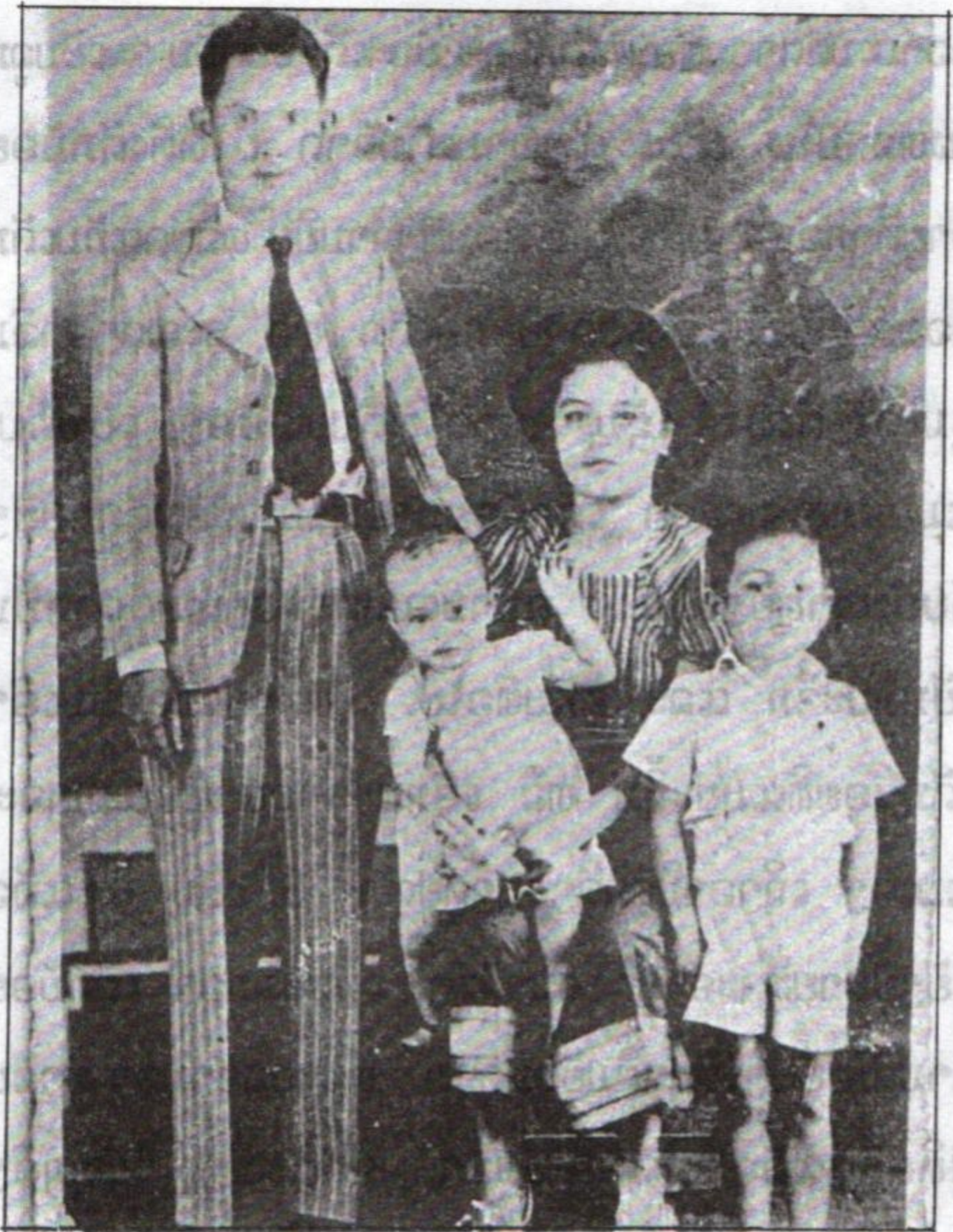
ແມ່ກັບພໍ່, ເອ້ອຍດາຣາ ( ອຸ້ນ ), ອ້າຍຄິດ ທີ່ ກຸງເທບ, ຄ.ສ. 1942 - ແມ່ຕ້ອງໃສ່ໝວກ ຕາມກົດລະບຽບ ຂອງສະຫຍາມສະໄຫມນັ້ນ