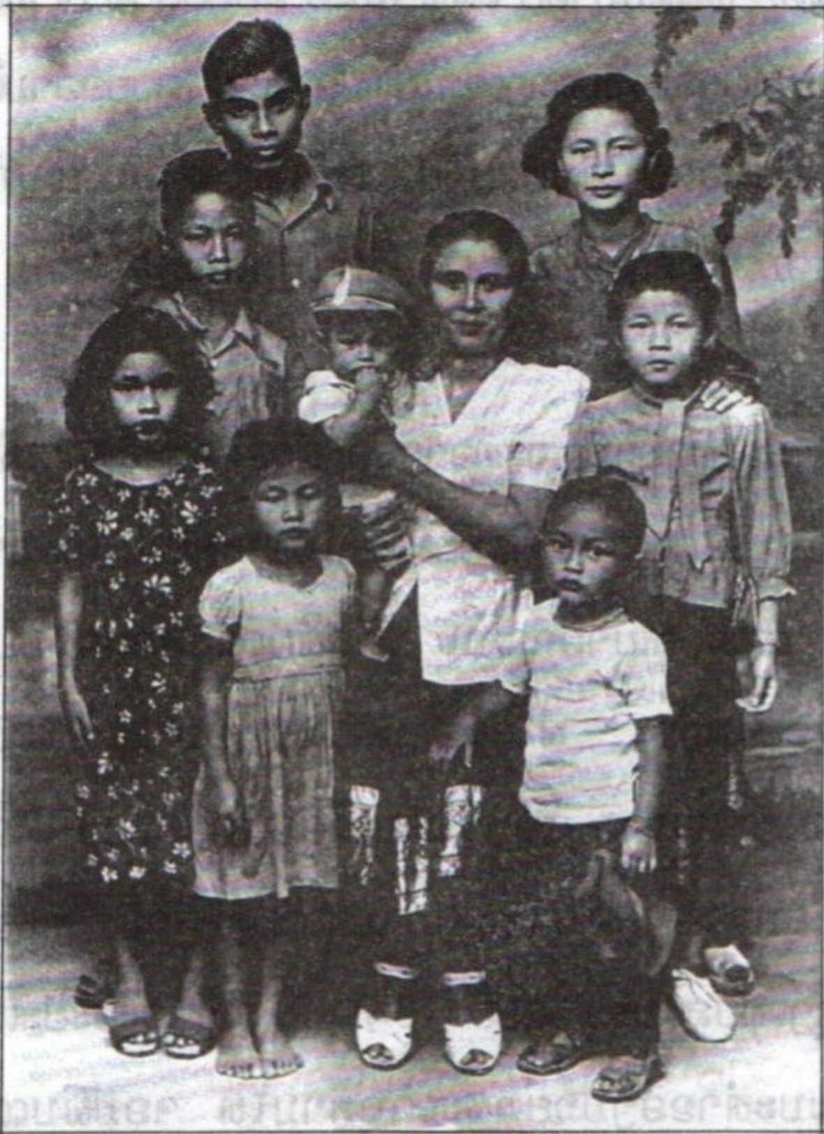
ແມ່ກັບລູກ 8 ຄົນ - ເສື້ອ ກະໂປງ ແລະ ໂສ້ງ ທີ່ລູກສາວໃສ່ ແມ່ນສິນແມ່ ຕັດຫຍິບເອງ.