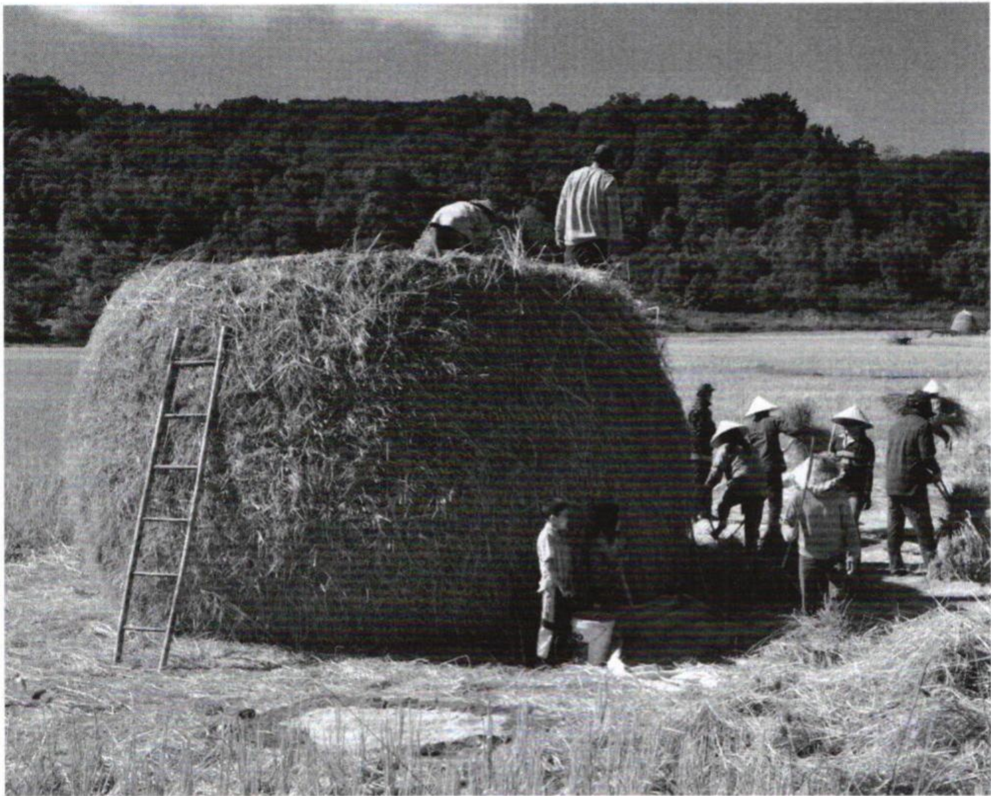
ຊ່ວຍກັນໃນລະດູເກັບກ່ຽວ ແຂວງຊຽງຂວາງ ຮູບຖ່າຍ ປີ 2009