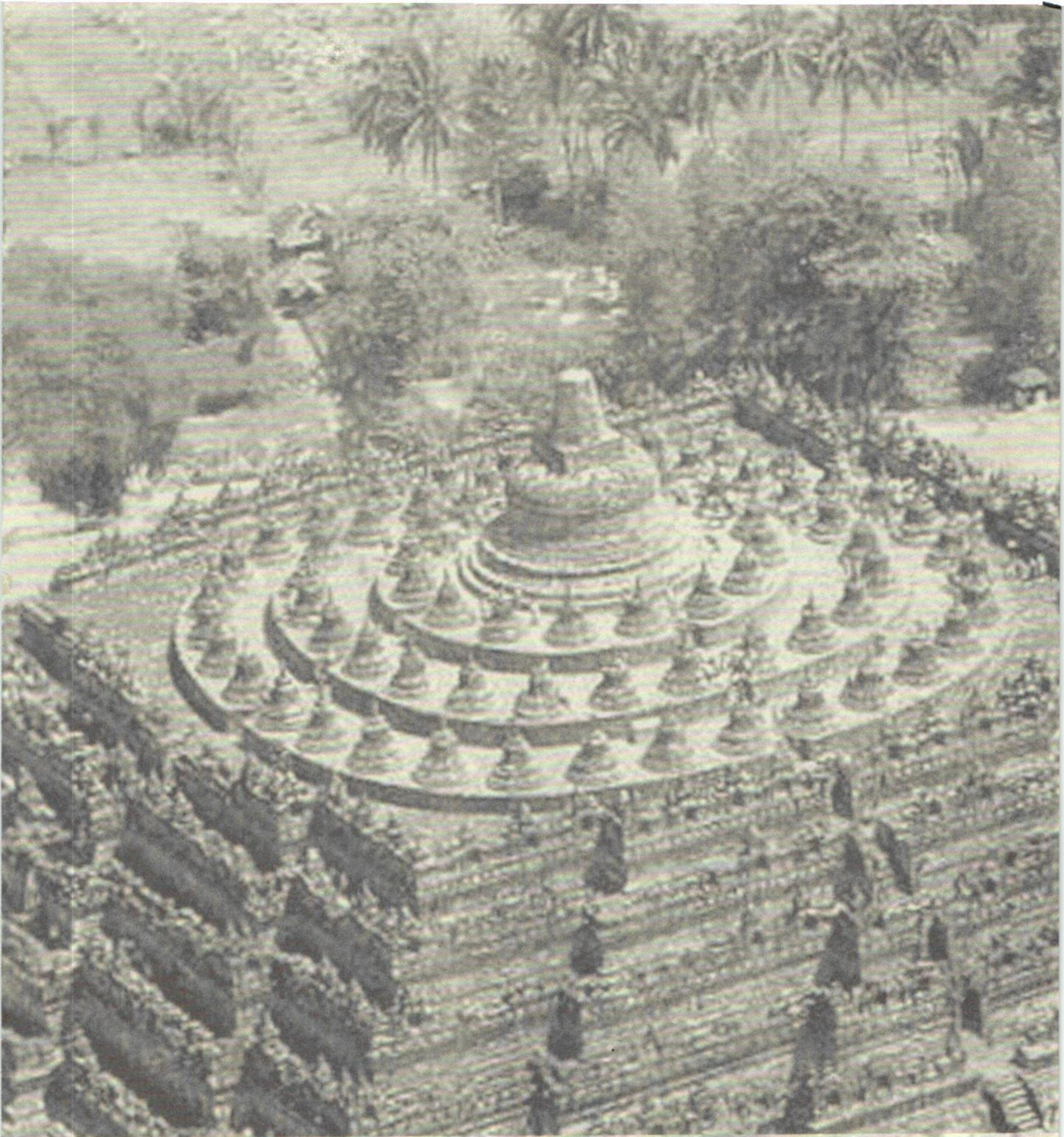
บรมพุทโธ ตั้งอยู่ใจกลางพื้นที่ราบเกตุ รายล้อมด้วยเทือกเขาและภูเขาไฟเมราปี ที่ยังมีปฏิกิริยาอยู่ เฉลี่ยงบนสุดยกพื้น 3 ระดับ รองรับพระสถูป 72 องค์ ล้อมรอบพระสถูปใหญ่องค์กลาง เป็นปริศนาหมายถึงสภาวะธรรม 72 รูป 18 เจตสิก 52 จิต 1 นิพพาน 1 ทั้งหมดของสภาวะ คือ มหาไวโรจน์อมิตาภะพุทธ มหาสุญญตาสุญญตา - ความว่างแห่งความว่าง