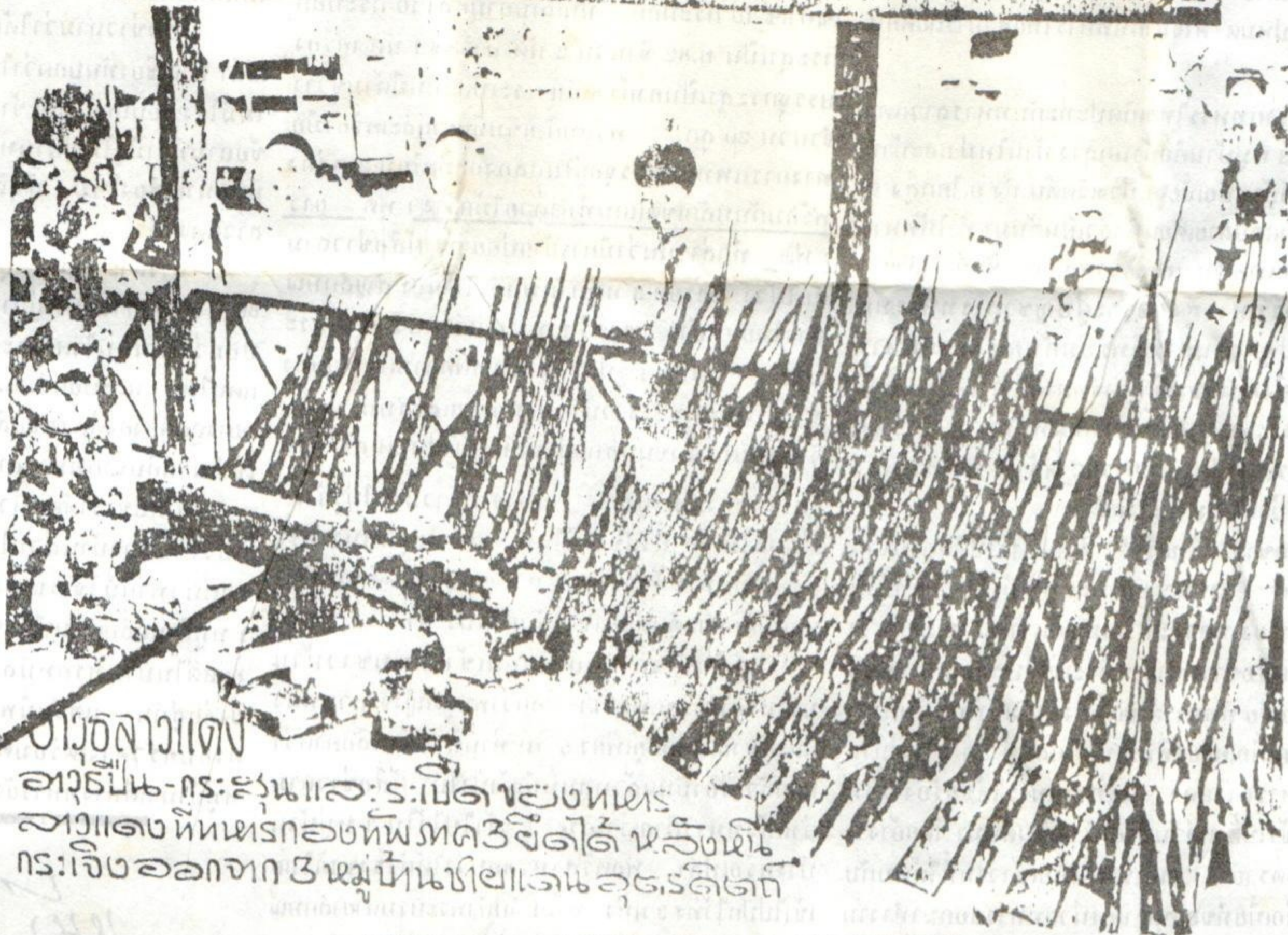
ช่างอลางแดง อวุธปืน-กระสุนและระเบิดของทหาร ลาวแดงที่ทหารกองทัพอากาศ 3 ได้ ผลิตขึ้น กระเจิงออกจาก 3 หมู่บ้านในลาวแดงลูตริลิต

ตัวักตามายเขตแดน ( ลาว-ไทย ) ที่พวกปะติการมอว้าจัดในกองทัพไทย สังกัทธิลัทธิอว้าออก พายตัวักที่พวก อว้ามีกองทัพตามไทยรุกฐานบรณยึด 3 ตำบลตามของลาว ( บามโตม, บามภวภูลละ บามสะทอว ) ในวันที่ 6/6/84. ( ตัวักตามายเขตแดนเร็ดดอยไม้ )