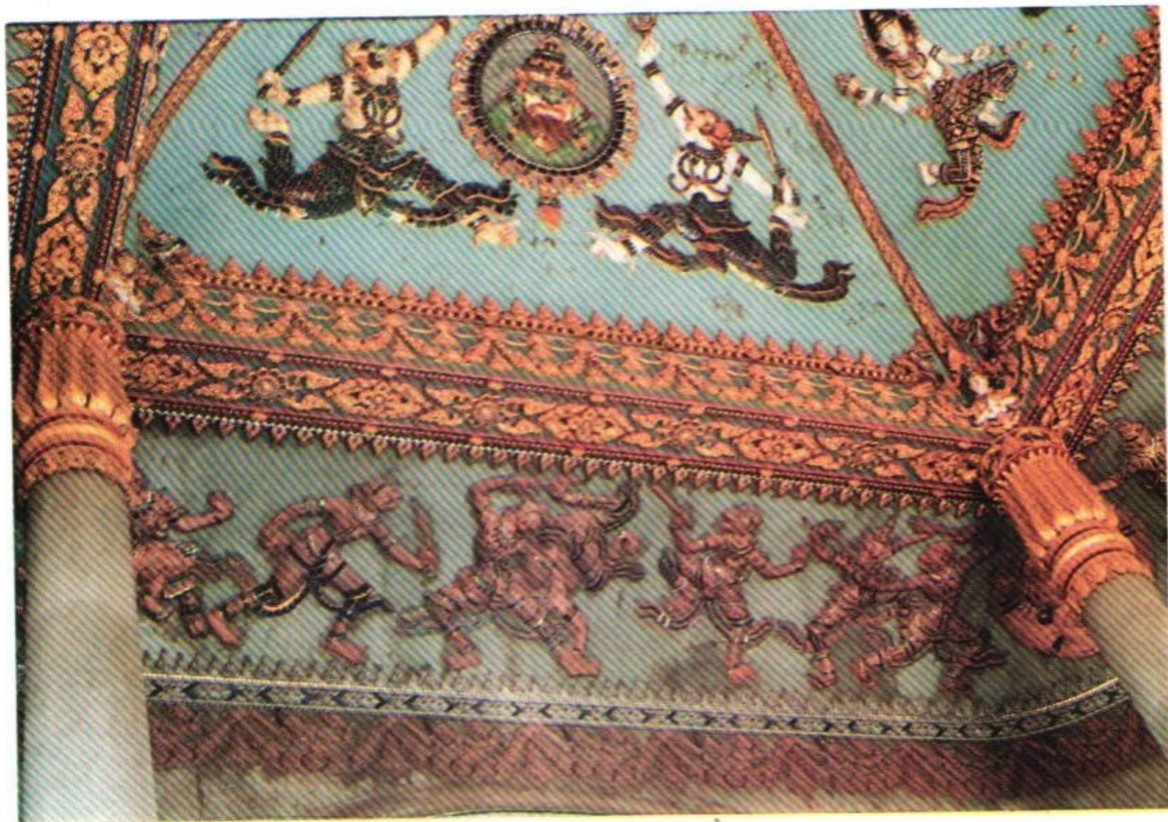
រូបປະព័ទ្ធជាមហាបទព្វឌុ