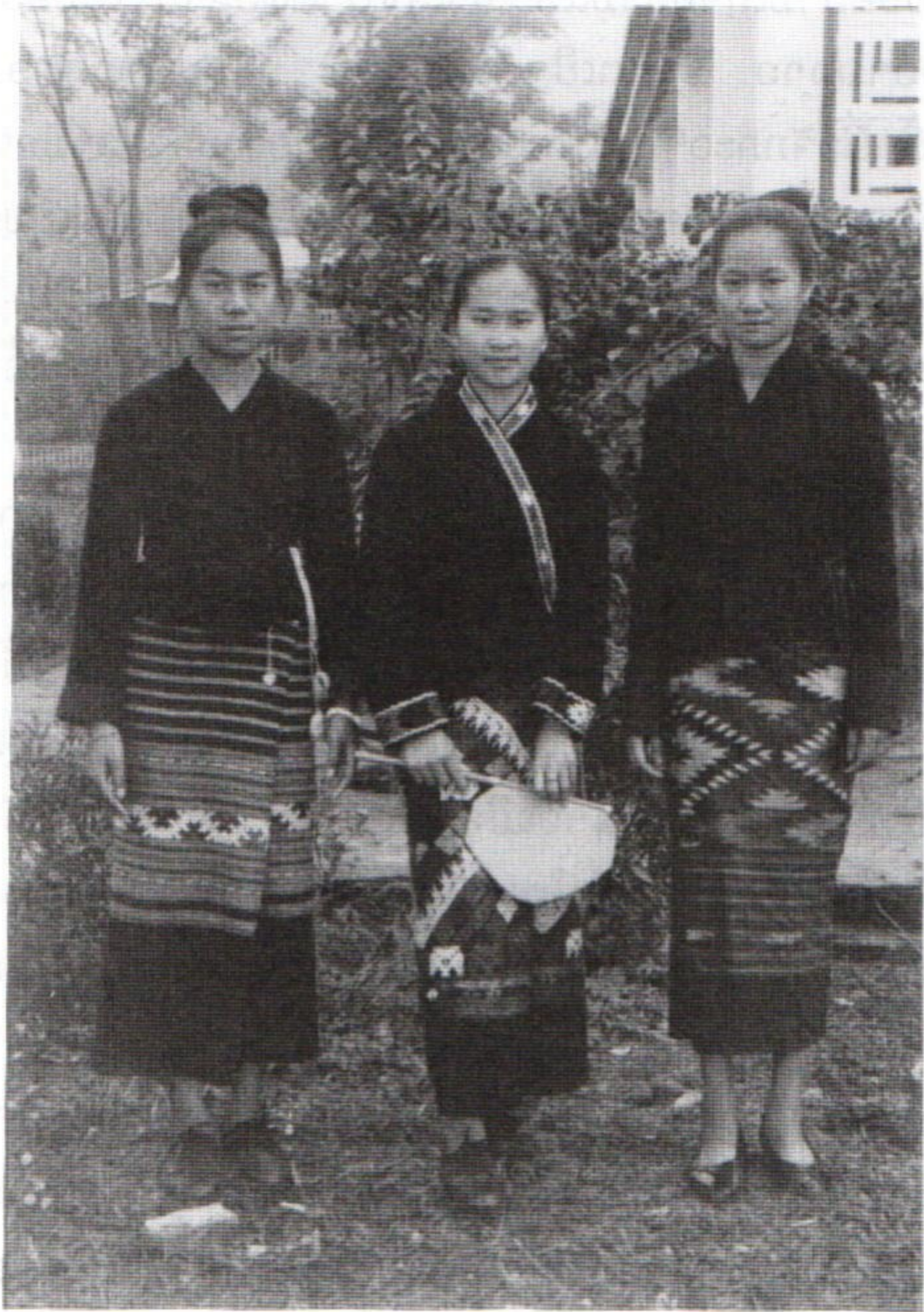
ການນຸ່ງຖືຂອງຊົນເຜົ່າລື້ ໃນງານວາງສະແດງເຄື່ອງນຸ່ງຫົ່ມຊົນເຜົ່າ ແຂວງອຸດົມໄຊ