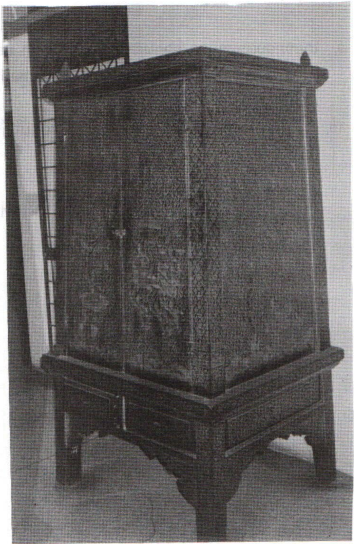
ຕູ້ຄຳຟີໃບລານ ທີ່ບູຮານນຳໃຊ້ເປັນບ່ອນເກັບຮັກສາເອກະສານໃບລານ ເຫັນໄດ້ໃນທຸກໆພາກຂອງປະເທດລາວ