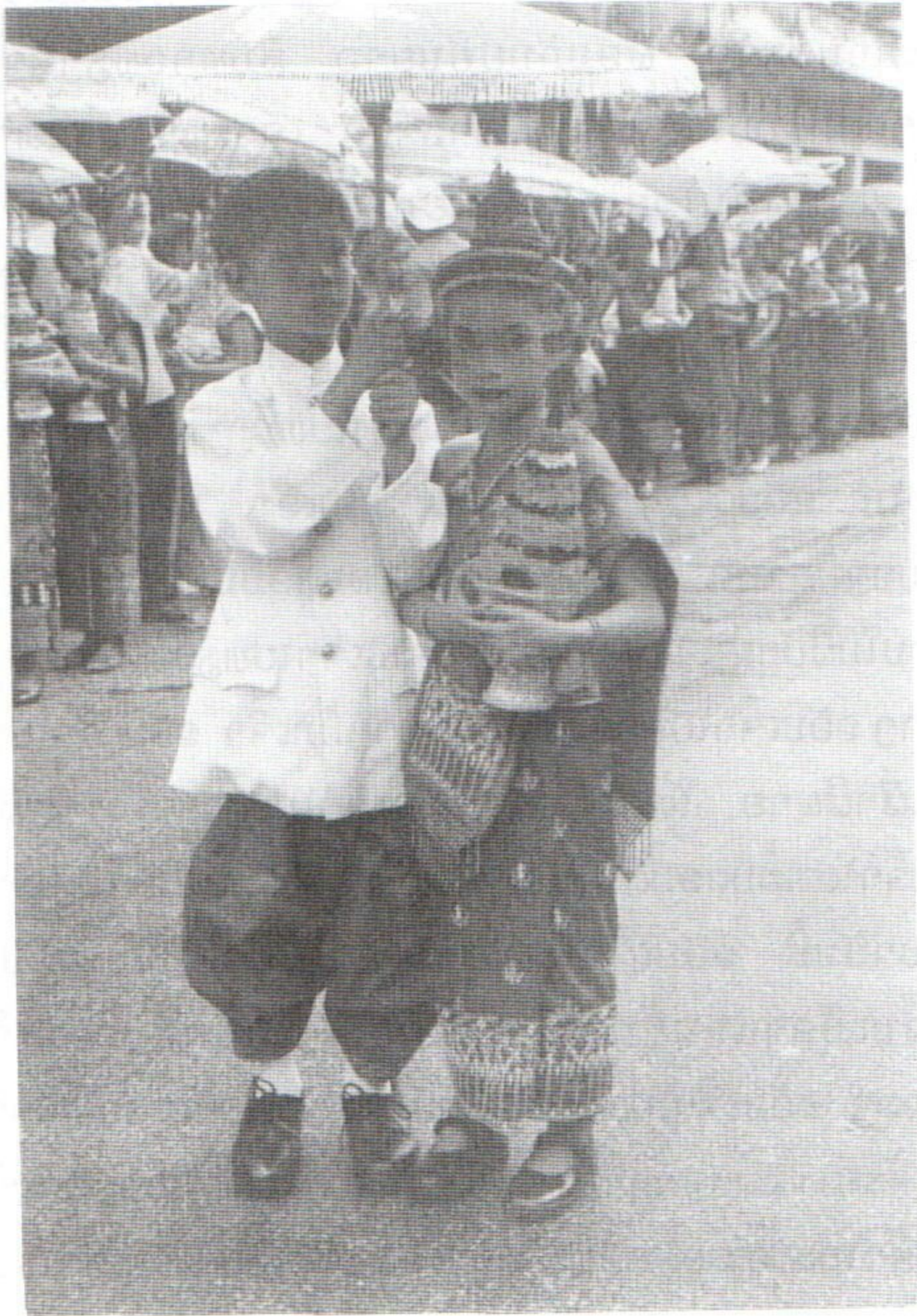
ການນຸ່ງຖືຕາມປະເພນີບູຮານ ໃນພິທີແຫ່ພະບາງ ເພື່ອລົງຫົດສິງ ໃນວັນປີໃຫມ່ລາວ ທີ່ ແຂວງຫລວງພະບາງ