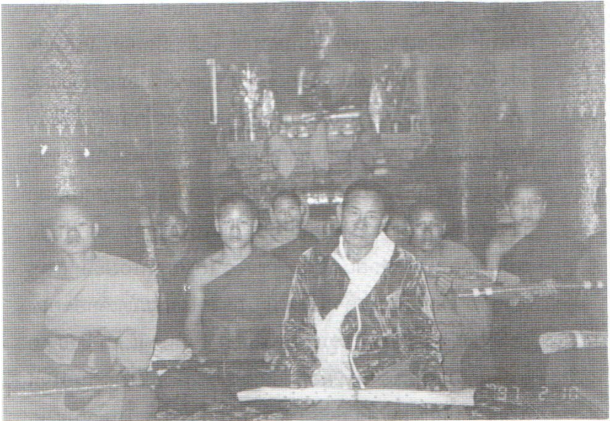
ການສຶກສາຮ່າຮຽນອັກສອນທຳ ຂອງສາມະເນນບ້ານຊຽງແມນ ສະມາຊິກນັກຮຽນຂອງລູເອັມມັງ ເມືອງຈອມເພັດ ແຂວງຫລວງພະບາງ

ທ່ານ ສິກສາ ຮ່າ ຮຽນ ອັກສອນທຳ ຂອງສາມະເນນບ້ານຊຽງແມນ ສະມາຊິກນັກຮຽນຂອງລູເອັມມັງ ເມືອງຈອມເພັດ ແຂວງຫລວງພະບາງ