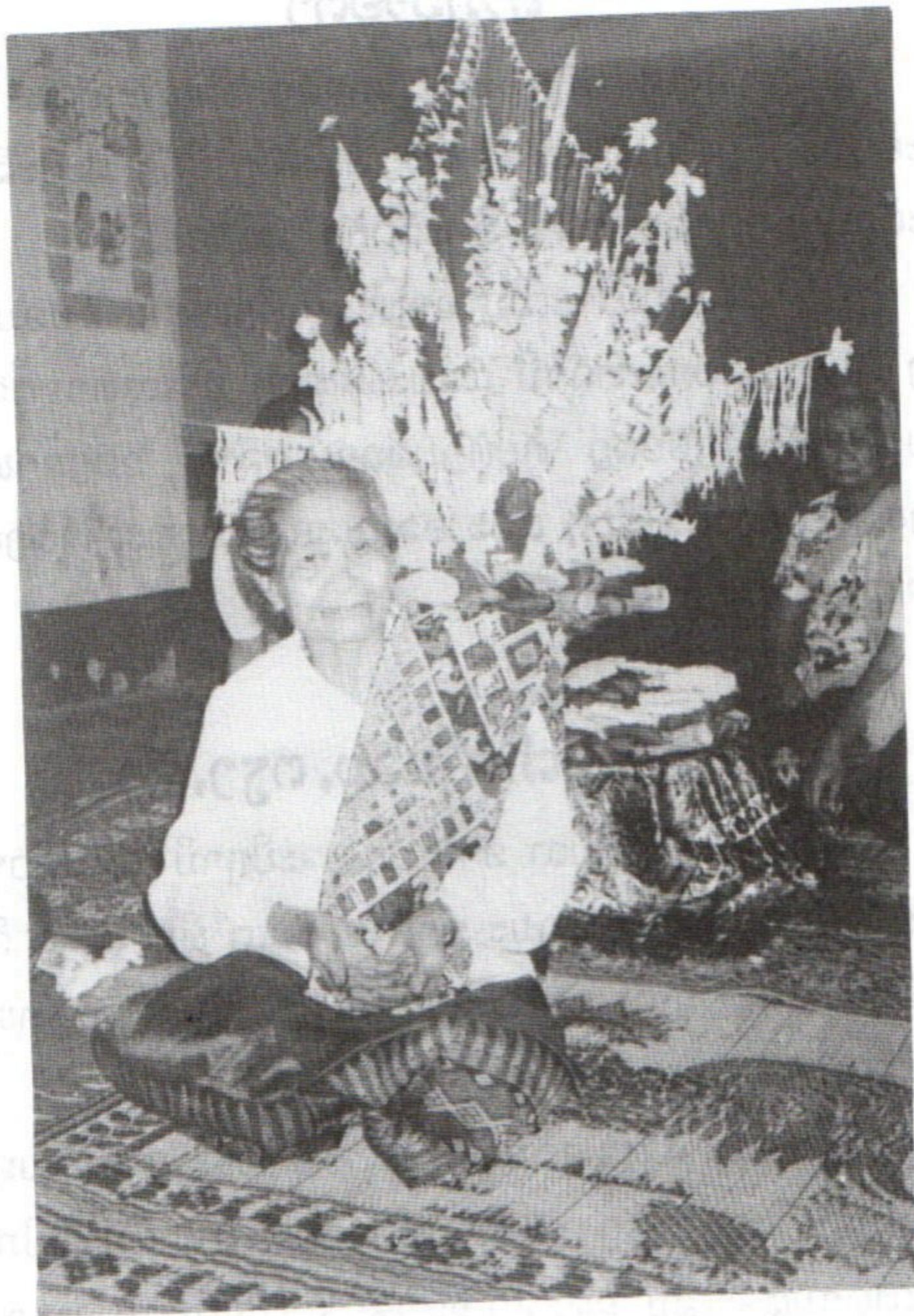
ການຈັດແຕ່ງພາບາສີແບບພື້ນເມືອງ ຂອງຊາວເມືອງຂວາ ແຂວງຜົ້ງສາລີ