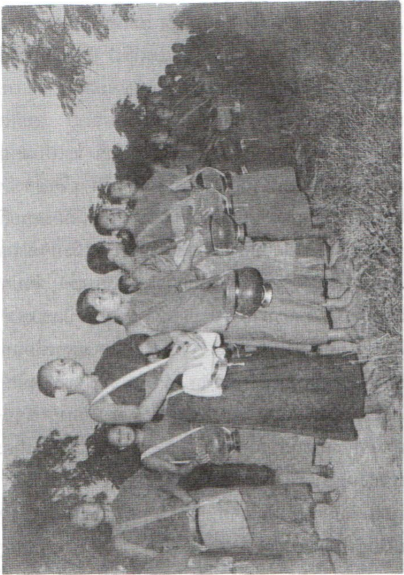
ໃນງານບຸນເທສະການຕ່າງໆ ພະສິງສາມະເນນຈະອອກບິນທະບາດ ເພື່ອໃຫ້ອອກຕົນຍາດໂຍນໄດ້ກິນຫານ ທີ່ ແຂວງອຸດົມໄຊ