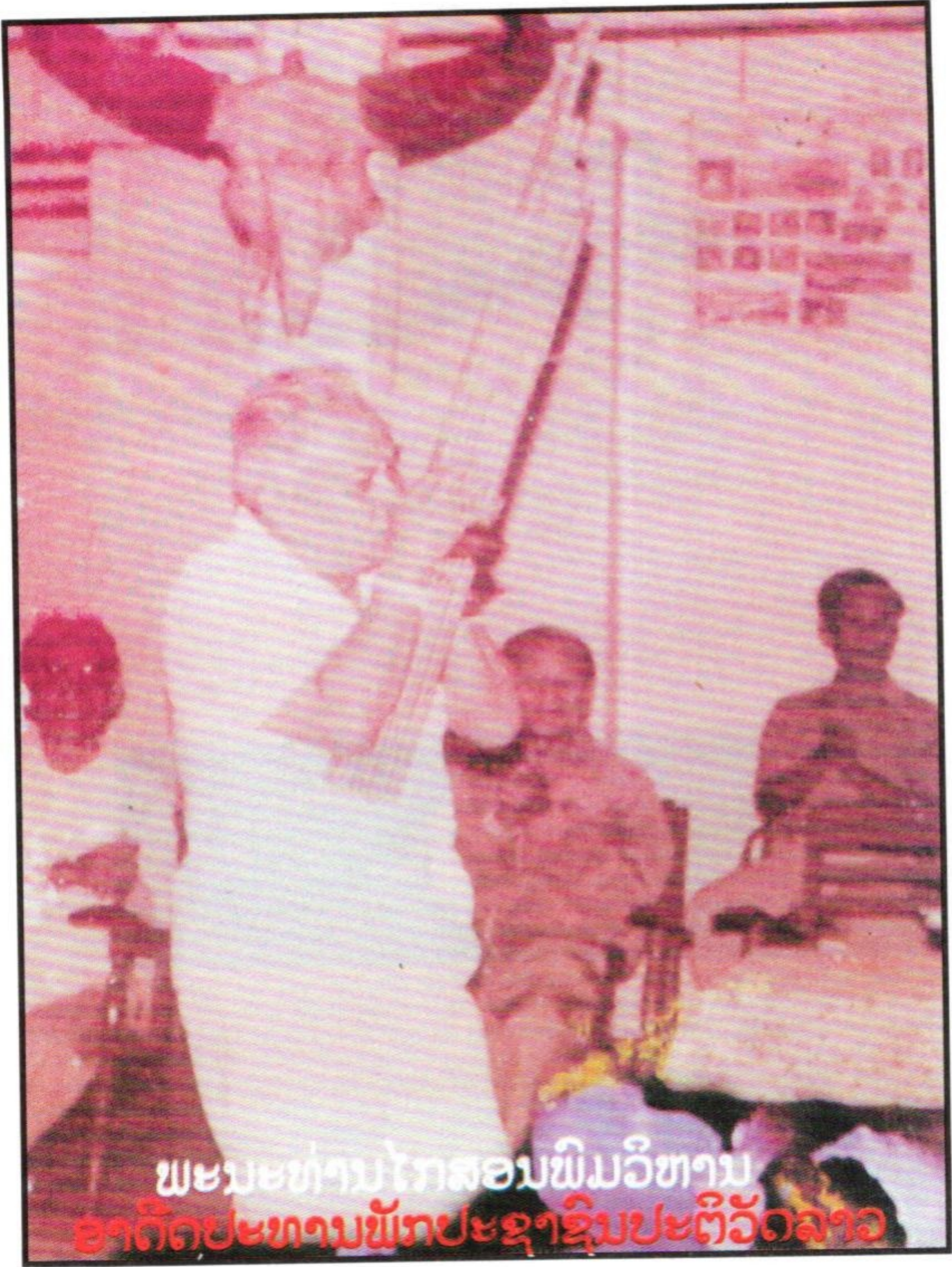
ພະນະທ່ານໄກສອນພິມວິຫານ ອາດີດປະທານພັກປະຊາຊົນປະຕິວັດລາວ