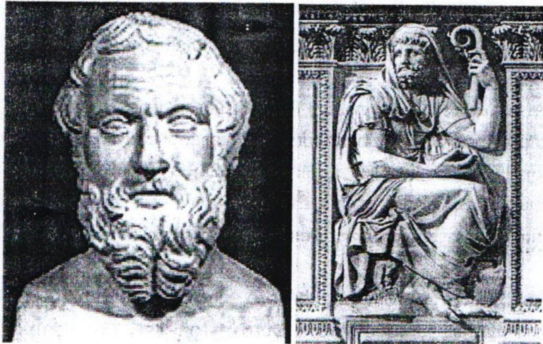
ຮູບ: ທ່ານ ເຮໂຣໂດຕັສ (Herodotus 484- 425 BC )

ຄຳວ່າ “ປະຫວັດສາດ” ມີເຄົ້າຄຳສັບມາຈາກ ພາສາກະເລັກວ່າ “ Histori ” ຊຶ່ງກົງກັບພາສາອັງກິດ ວ່າ “ History ” ຊຶ່ງໝາຍເຖິງ ການຄົ້ນຄ້ວາ, ກວດກາ, ສອບສວນ ແລະ ການສອບຖາມ ໃນບັນຫາທີ່ເອົາມາປະກອບ ແລະ ຈັດຮຽງລຳດັບເຫດການໃຫ້ຖືກຕ້ອງສອດຄ່ອງກັບກາລະ ເວລາ ໂດຍມີການວິເຄາະວິພາກຢ່າງມີເຫດຜົນ. ຜູ້ບັນຍັດຄຳສັບນີ້ ຂຶ້ນມາໃຊ້ເປັນຄັ້ງທຳອິດ ຄື ທ່ານ ເຮໂຣໂດຕັສ (Herodotus 484- 425 BC ) ຊຶ່ງເປັນນັກປາດຊາວກະເລັກບູຮານ ຜູ້ທຳອິດທີ່ໄດ້ວາງລະບົບກ່ຽວກັບວິທີການຈົດກ່າຍ, ການບັນທຶກເລື່ອງລາວຄວາມເປັນມາໃນອະດີດຂອງຊຸມນຸມຊົນຕົນເອງ ແລະ ຊຸມນຸມຊົນອື່ນ. ວິທີການບັນທຶກຂອງທ່ານໄດ້ຮັບການຍົກຍ້ອງຈາກຄົນທັງຫຼາຍ ແລະ ໃຫ້ສົມຍານາມວ່າ “ ເປັນບິດາແຫ່ງປະຫວັດສາດ ”.